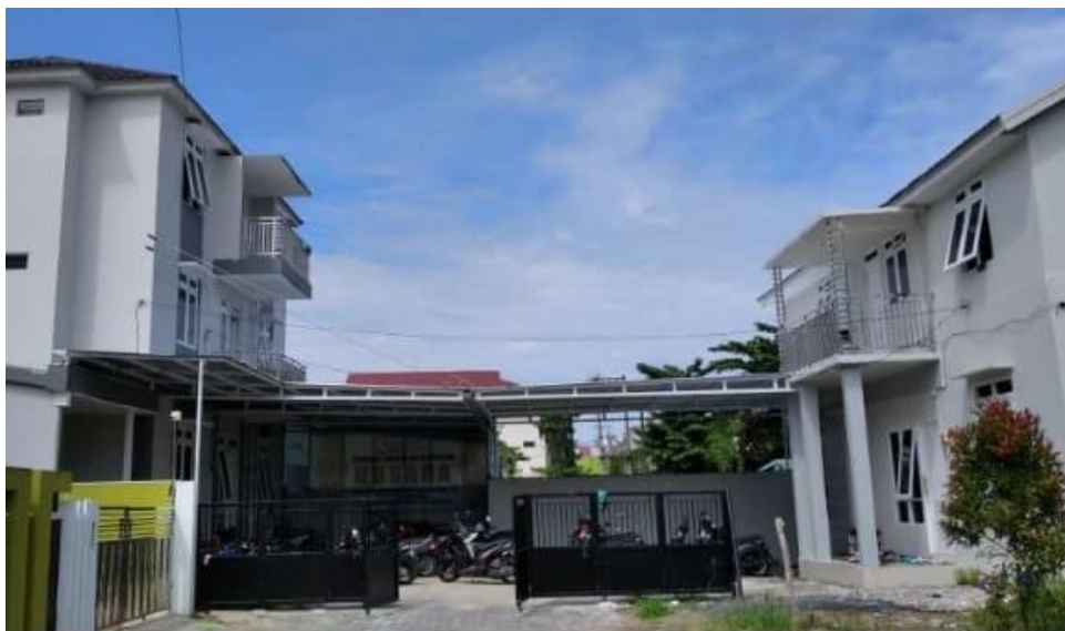
Gambar 4. 1 Bangunan Asrama Mahasiswi Tahfiz Husada

Pembangunan awal dari Asrama Tahfiz ini hanya dibangun 1 asrama saja yang terdiri dari 4 lantai kemudian karena melihat keadaan mahasantriwati yang terus bertambah maka dibangun kembali 1 asrama yang terdiri dari 2 lantai pada tahun yang sama. Alhamdulillah asrama ini terbuat dari bangunan beton sehingga kondisi asrama cukup kuat untuk dibangun bertingkat. Adapun sistem pendidikan dari asrama tahfiz Al Qur'an ini memiliki perbedaan dengan asrama pada umumnya yang ada di pondok pesantren salafi yang menekankan pada penguasaan kitab kuning sedangkan asrama ini lebih menekankan mahasantriwatinya dalam menghafal Al Qur'an.