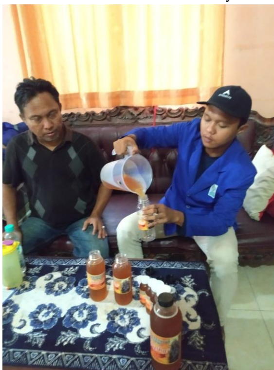
Proses Pengemasan Hasil Panen Madu Lebah Kelulut yang Kemudian Siap Untuk Dipasarkan.