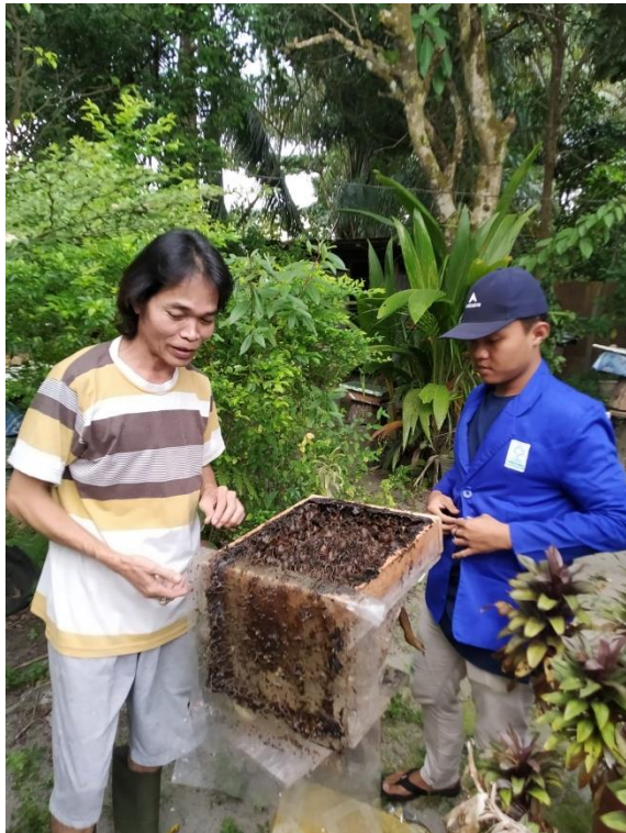
Foto Bersama Karyawan Usaha dan Memproduksi Madu Lebah Kelulut