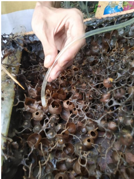
Isi Sarang Lebah Kelulut ketika Dipanen Menggunakan Alat Hisap