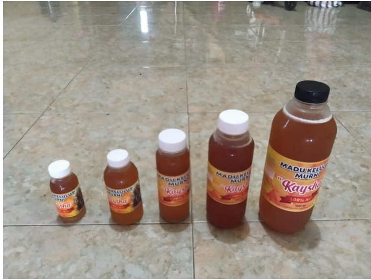
Kemasan Madu Kelulut “Kasyha” dengan Berbagai Macam Ukuran