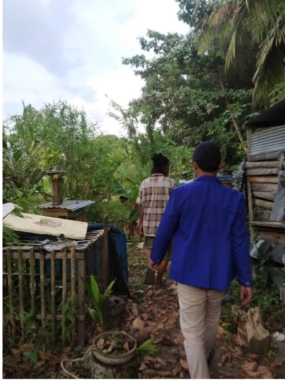
Observasi Lokasi Usaha Madu Kelulut “Kaysha” Kasongan, Kabupaten Katingan