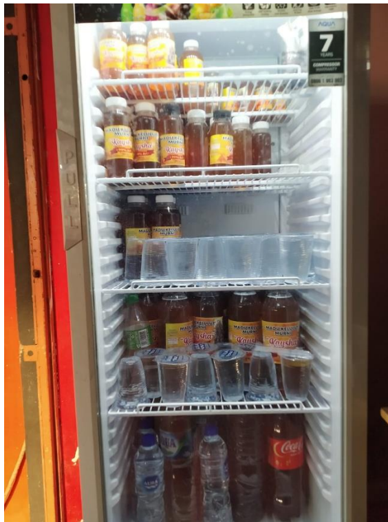
Hasil Produksi Madu Lebah Kelulut “Kaysha” yang Diletakkan di Mesin Pendingin