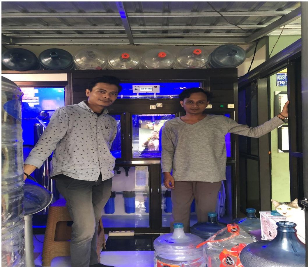
Foto 11. Usaha Pengisian Ulang Air Mineral