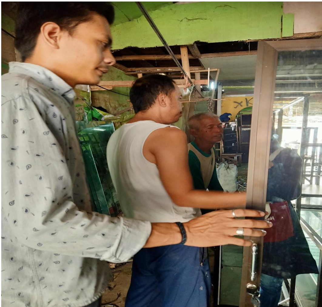
Foto 9. Usaha Stenless Aluminum