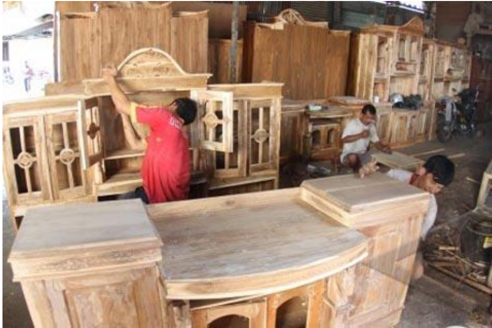
Foto 1. Usaha Pengolahan Meubel