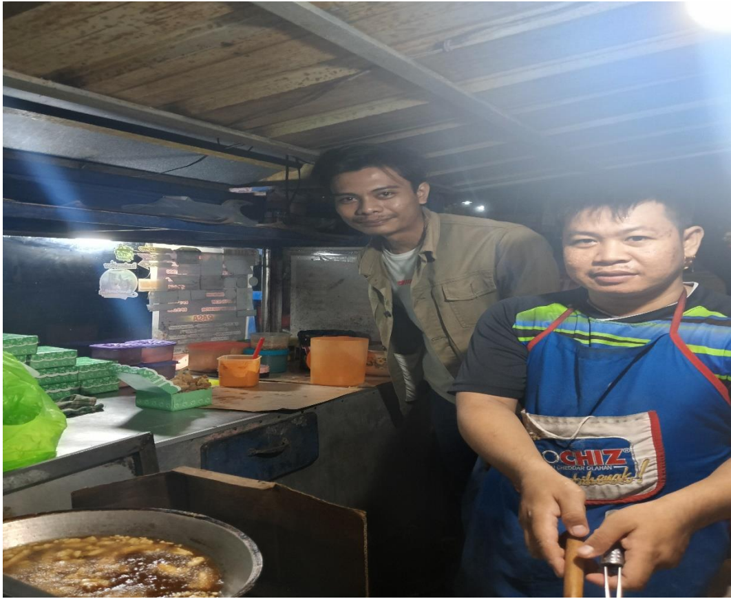
Foto 7. Usaha Makanan Ringan