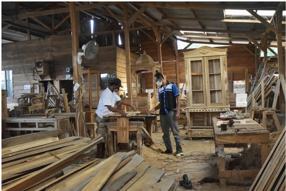
Foto 2. Usaha Pengolahan Meubel