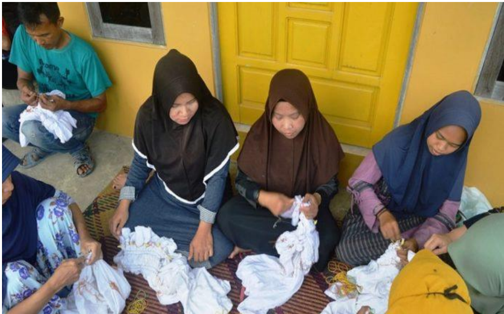
Foto 4. Usaha Pengolahan Bahan Pakaian