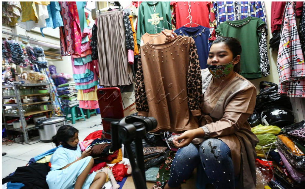
Foto 6. Usaha Penjualan Pakaian