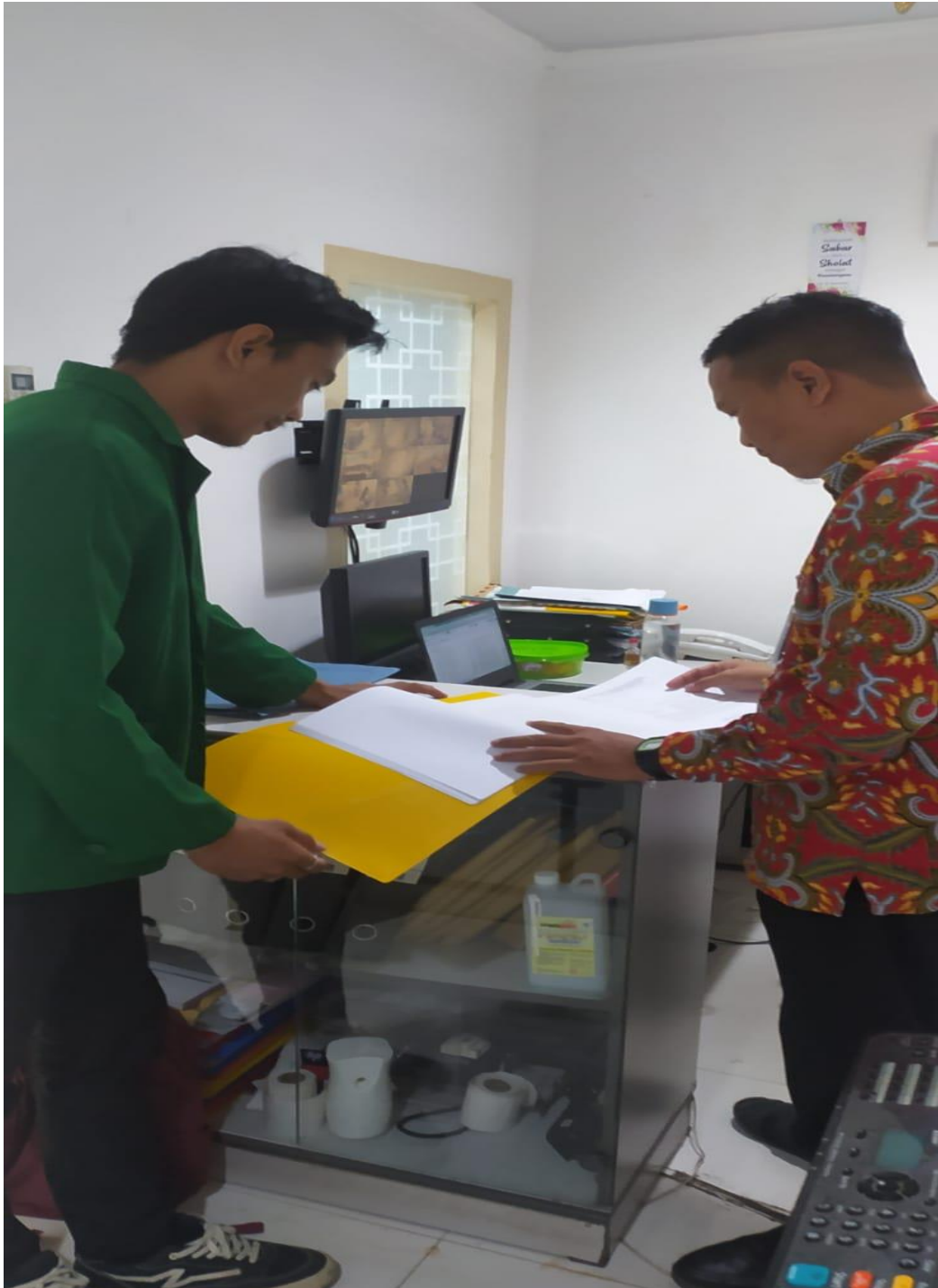
Foto Bersama BOSM