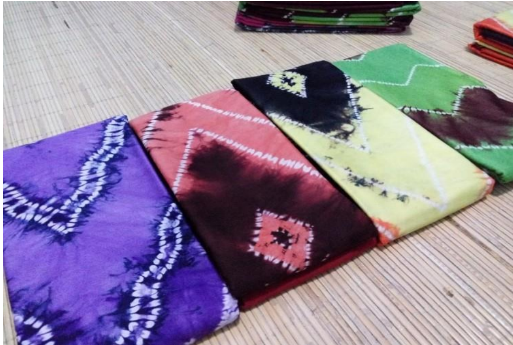
Foto 5. Usaha Pengolahan Bahan Pakaian