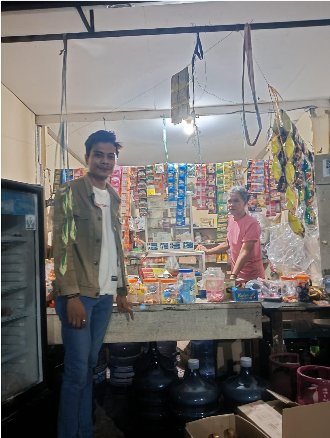
Foto 8. Usaha Warung Sembako