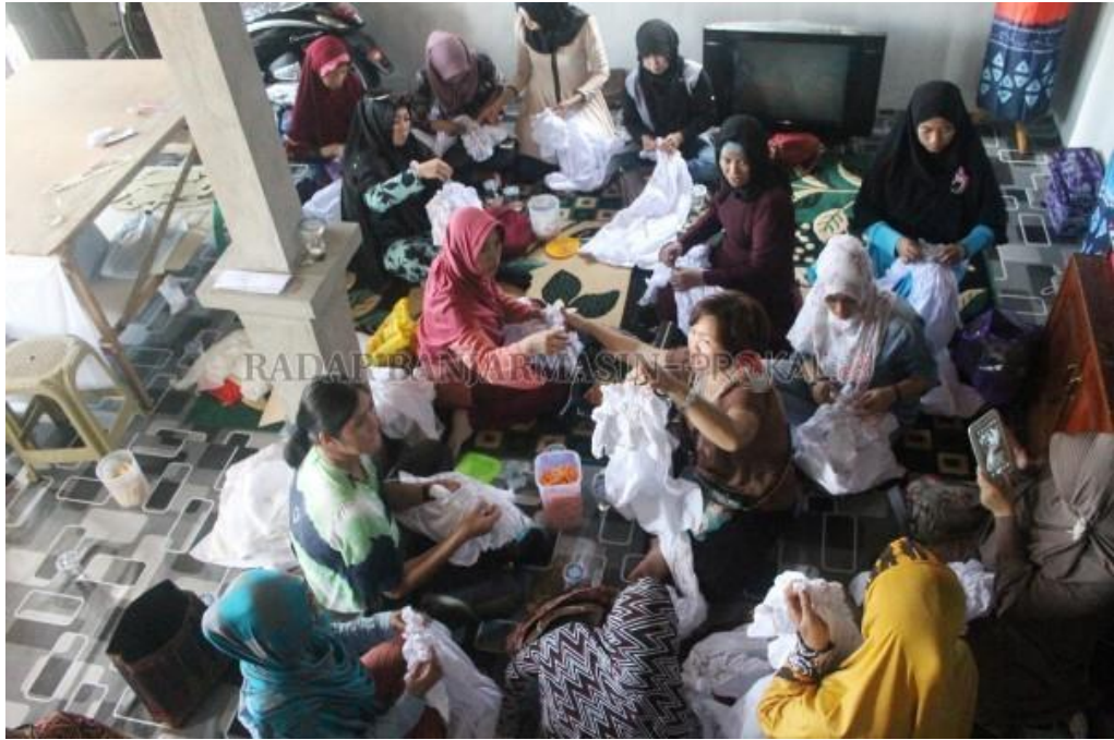
Foto 3. Usaha Pengolahan Bahan Pakaian