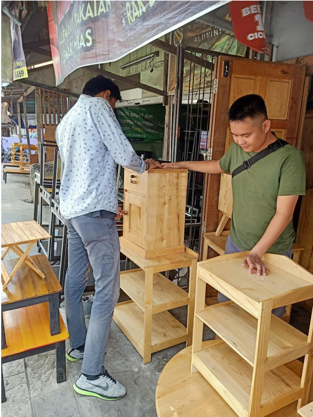
Foto 10. Usaha Meubel