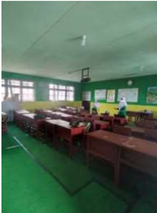
Ruang Kelas MIN 2 Banjarmasin