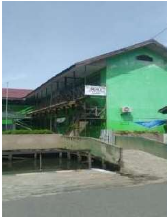
Lingkungan MIN 2 Banjarmasin Tampak Depan