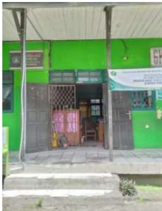
Ruang Guru MIN 2 Banjarmasin Tampak Depan