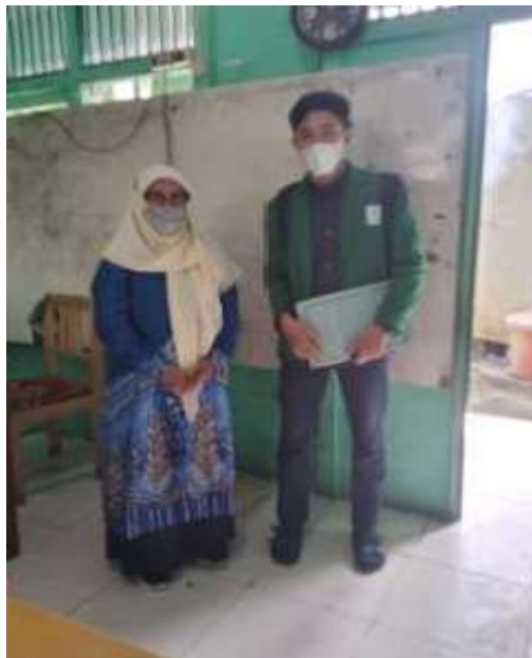
Bersama Ibu Guru Bimbingan Khusus MIN 2 Banjarmasin