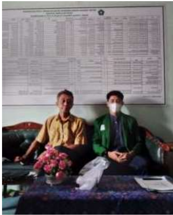
Bersama Bapak Kepala Sekolah MIN 2 Banjarmasin