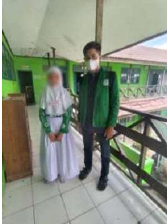
Bersama Siswi MIN 2 Banjarmasin