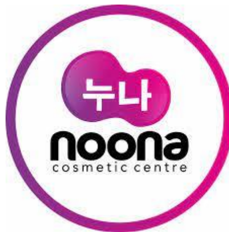
Gambar 4.1 Logo Noona Cosmetic Centre Banjarmasin