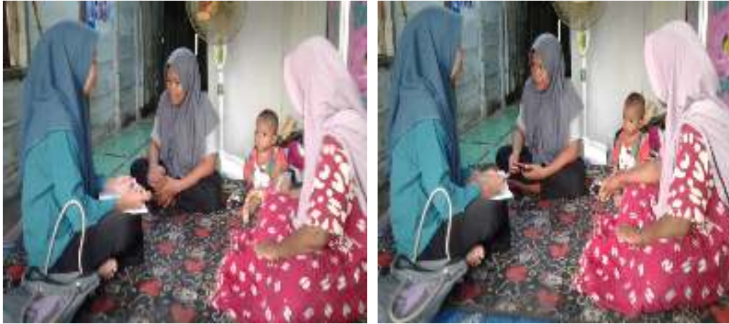
Wawancara bersama saudari N dan Ibu Y dirumah informan, Sungai Telan Kecil.