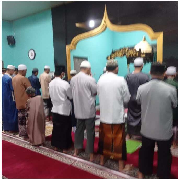
Salat Tarawih di Masjid Al-Qadar