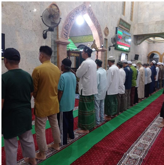
Salat Tarawih di Masjid Al-Munawwarh