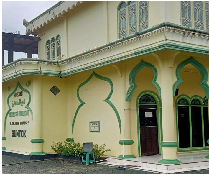
Masjid Nurush Siddiq