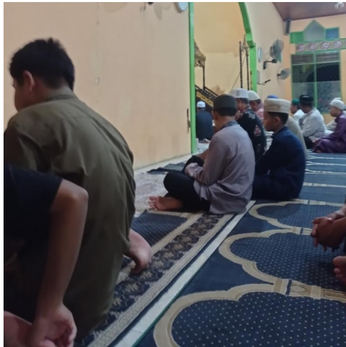
Salat Tarawih di Masjid Nurul Huda Raut