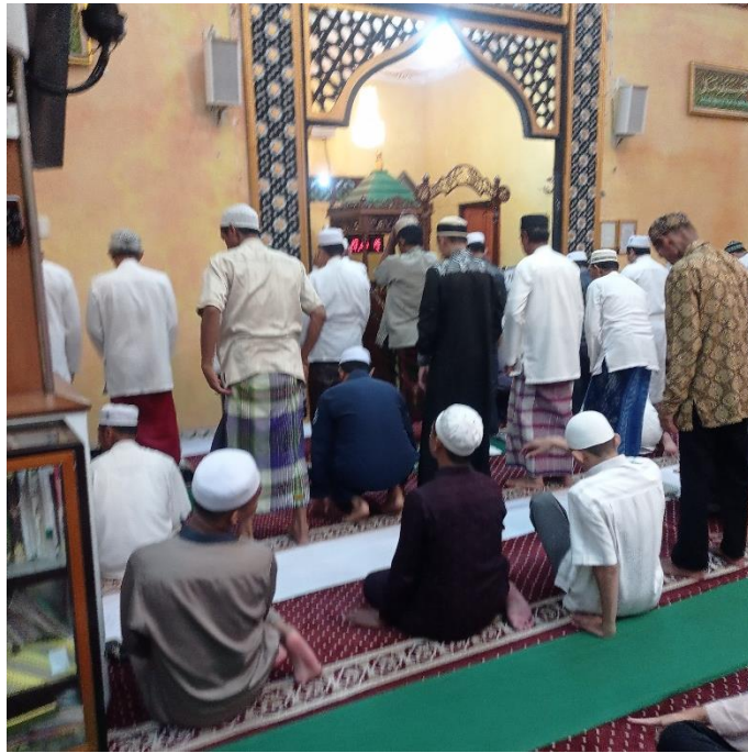
Salat Tarawih di Masjid Shiratul Jannah