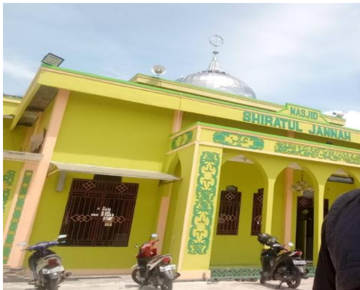
Masjid Shiratul Jannah