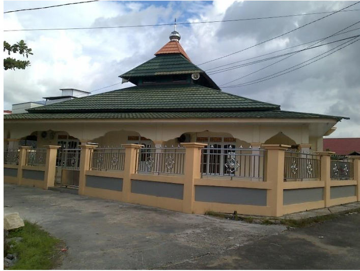
Masjid Nurul Fajar