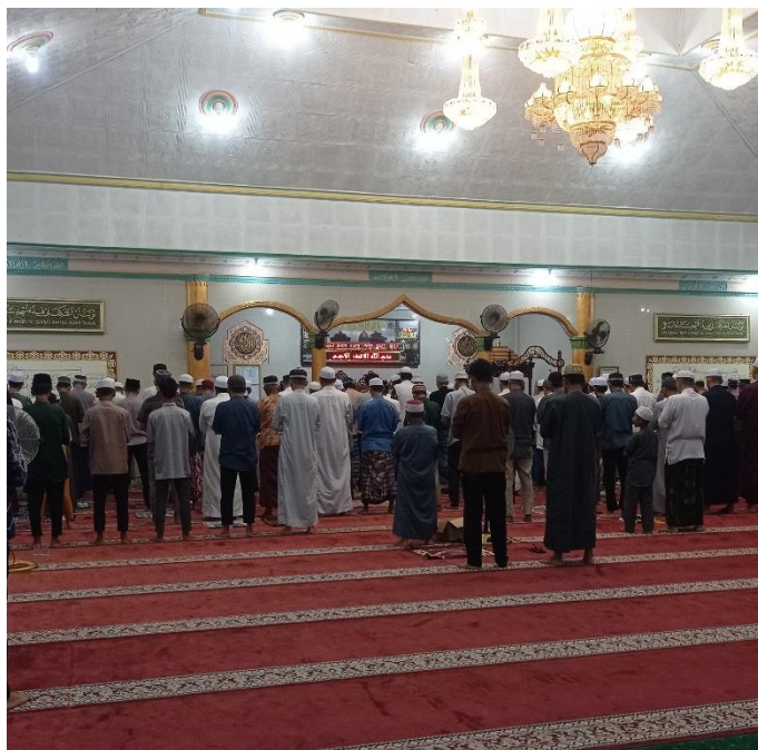
Salat Tarawih di Masjid Agung Baiturrahman