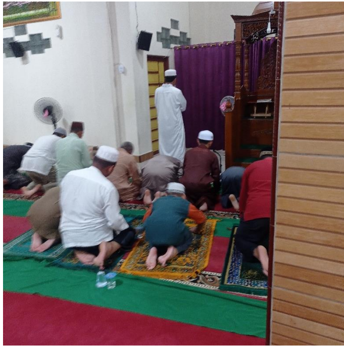
Salat Tarawih di Masjid Ar-Raudah