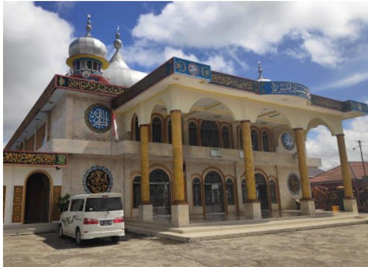
Masjid Besar Al-Munawwarah