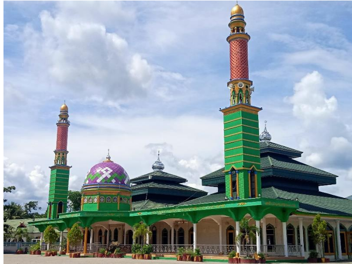
Masjid Agung Baiturrahman