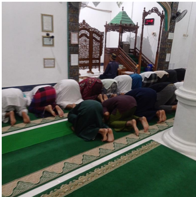
Salat Tarawih di Masjid Nurush Shadiq