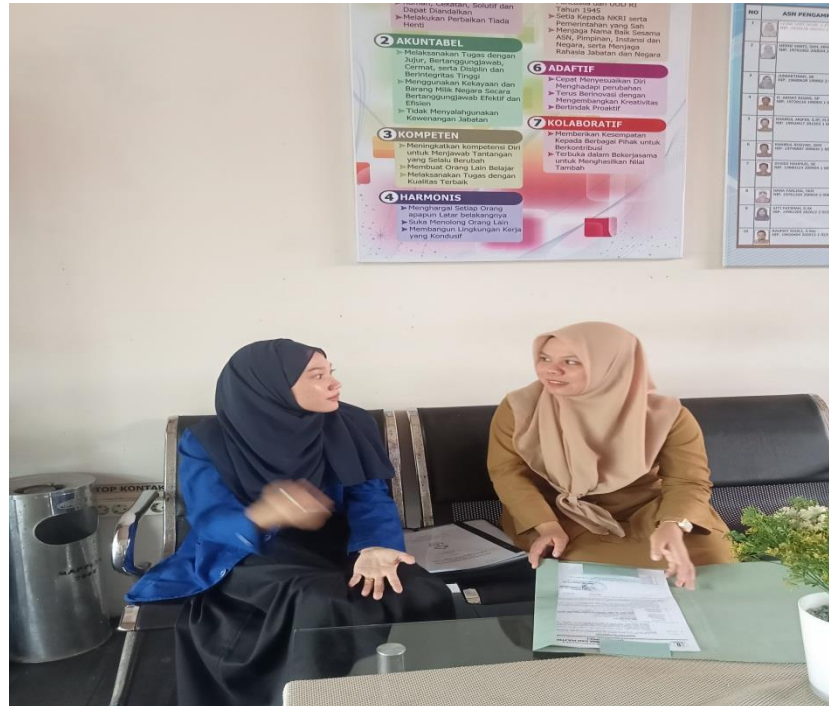
Foto Wawancara dengan panitia pengangan perangkat desa