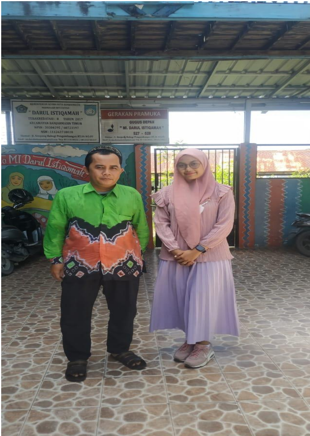
Lampiran 1. 19 Sesi Foto 1