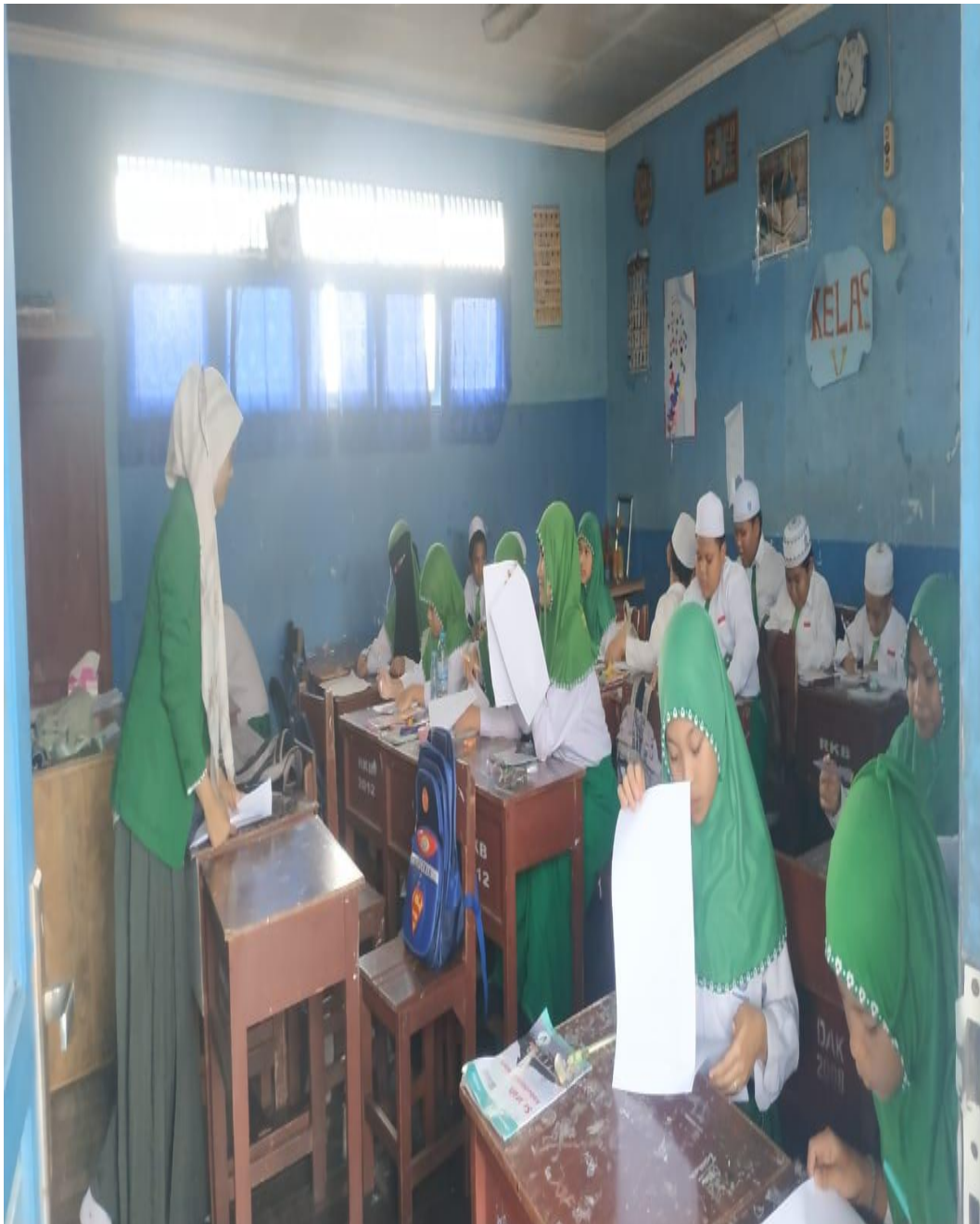
Lampiran 1. 8 Pengisian Kuesioner