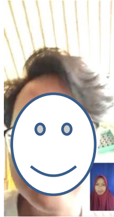
Wawancara responden 2 MAA, tanah grogot