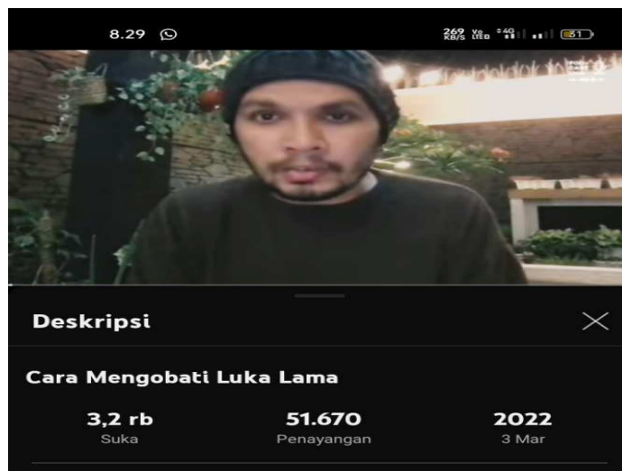
Gambar 4. 4 Cara Mengobati Luka Lama

Di durasi 02:59. Berbuat kepada orang lain ini lebih tinggi derajatnya kalau sekarang lebih dari sholeh yaitu ikhsan. Balaslah keburukan orang lain dengan kebaikan.