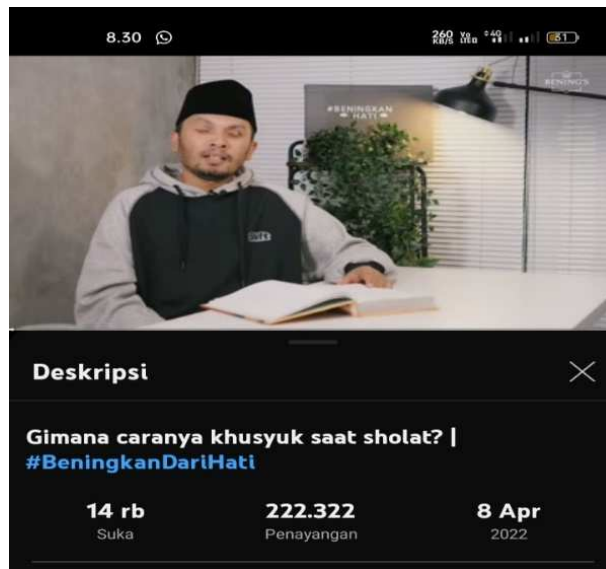
Gambar 4. 5 gimana Cara Khusyuk saat sholat

Di durasi 0:38 Apa itu khusyuk? Kalau kita pengen Allah turunkan rahmat kepada kita maka syaratnya harus Khusyuk.