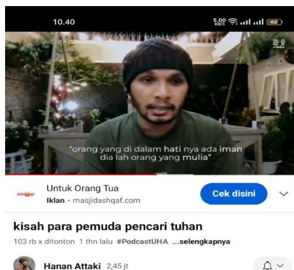
Gambar 4. 1 Kisah Para Pemuda pencari tuhan Rilis tanggal 7 Januari 2022

Di durasi 2:59 - 3:17 siapa Ashabul Kahfi itu? Ashabul Khafi adalah sekelompok para pemuda walaupun tidak menampilkan dirinya karena semangat anak muda membuat organisasi atau komunitas.