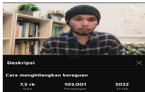
Gambar 4. 3 Cara menghilangkan keraguan

Durasi 5: 55 – 6: 25 semakin kita mikir tentang kebesaran Allah, semakin kita yakin sama Allah