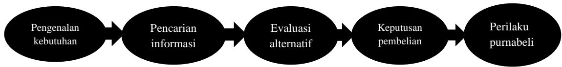
Gambar I Model Proses Pembelian Lima Tahap