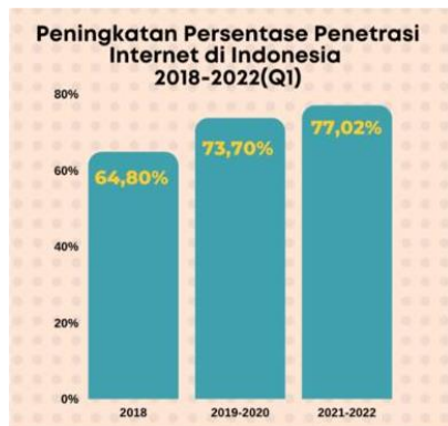
Gambar I Presentase Pengguna Internet di Indonesia 2018 – 2022

Berdasarkan data diatas, dapat diketahui bahwa pengguna internet mengalami kenaikan setiap tahunnya. Melalui survei yang dilakukan oleh Asosiasi Penyelenggara Jaringan Internet Indonesia (APJII) dan Lembaga Polling Indonesia, Lebih dari setengah masyarakat Indonesia telah terhubung ke internet. Pada tahun 2018 jumlah pengguna internet sebanyak 171,17 juta pengguna, pada tahun 2019 jumlah pengguna internet sebanyak 196,7 juta pengguna, dan pada tahun 2020- 2022 jumlah pengguna internet sebanyak 210,0 juta pengguna. Yang bersumber dari APJII (Asosiasi Penyelenggara Jasa Internet Indonesia).