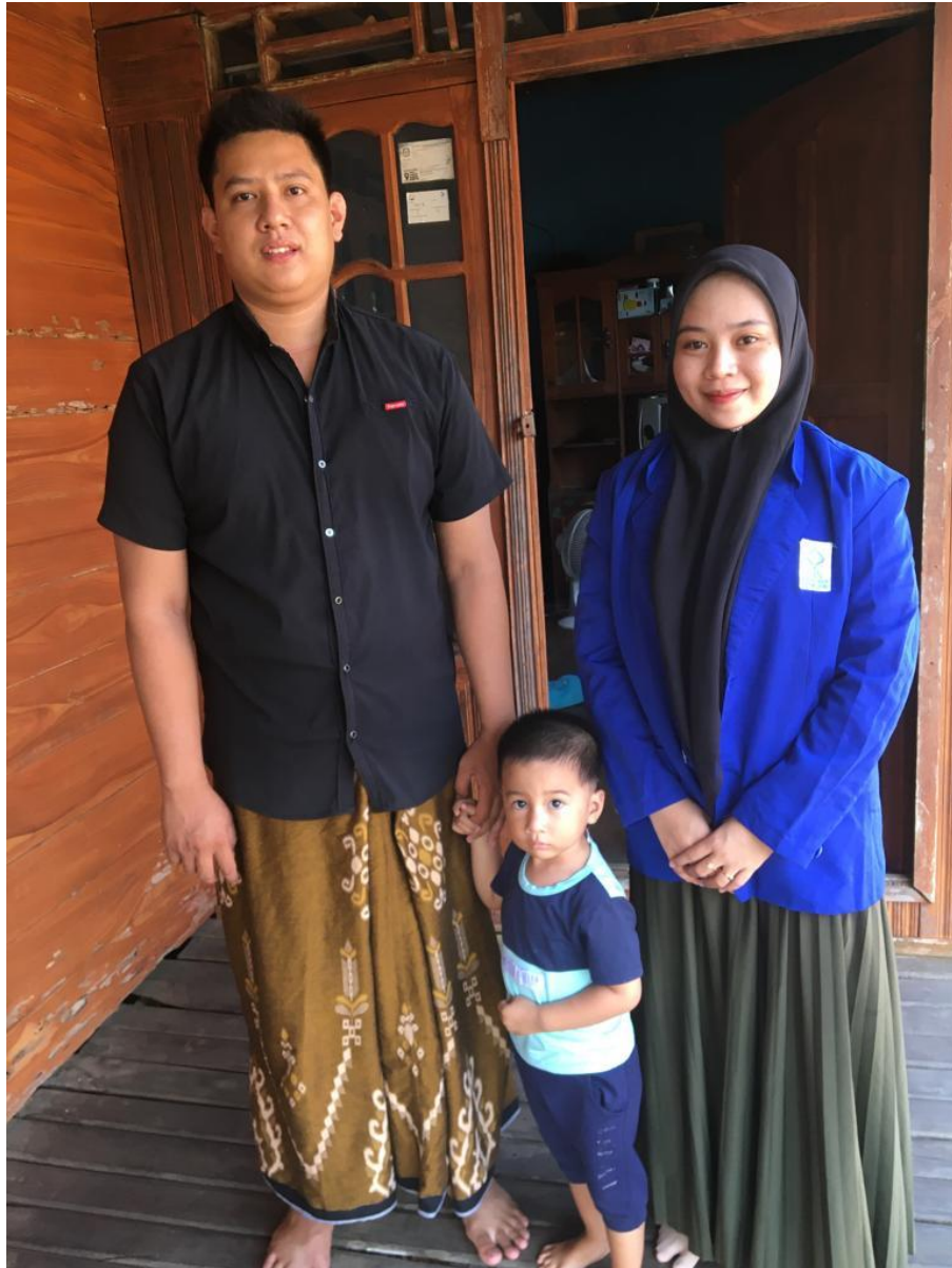
Foto wawancara penulis bersama Bapak Maharani Selaku Kasi (Kepala Seksi) di Kantor Desa Jilatan