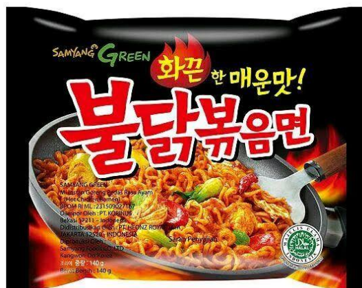
Gambar 4.2 Produk Samyang

Samyang merupakan mie instan produksi Samyang food.inc , mie instan ini memiliki rasa yang khas karena semua produk mie instan ini memiliki rasa yang pedas. Nama asli mie samyang ini adalah mie goreng rasa ayam pedas, namun tulisan latin yang terdapat pada produk kemasan hanya “ Samyang ” dan huruf lainnya merupakan huruf korea, maka masyarakat Indonesia lebih mengenalnya dengan sebutan mie Samyang . (Rizkyani, 2023, hlm. 10)