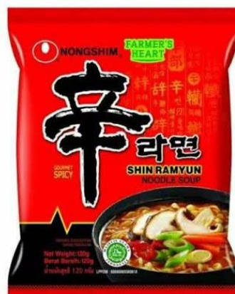
Gambar 4.1 Produk Ramyun

Ramyun atau ramyeon adalah hidangan mie asal korea yang dipengaruhi oleh hidangan china bernama lamian. Ramyun menjadi sangat populer karena mudah dimasak dan cepat dimakan sehingga dapat menjadi makanan yang sesuai untuk dimakan kapanpun. Ramyun korea juga memiliki rasa yang lebih kuat dan biasanya bercita rasa pedas. (Rizkyani, 2023, hlm. 10)