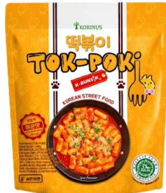
Gambar 4.3 Produk Samyang