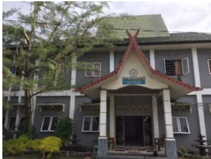
Gambar 4.1: Lembaga Kesejahteraan Sosial Anak Sentosa Banjarmasin

Pada tanggal 30 Mei 1955 Rumah pemeliharaan Anak Yatim diubah nama menjadi Yayasan Putri Asuhan “Sentosa” Banjarmasin dengan Akte Notaris No. 3 oleh Notaris Ali Harsojo. Kemudian pada tanggal 26 April 1986 Yayasan Putri Asuhan “Sentosa” Banjarmasin diubah menjadi Yayasan Kesejahteraan Sosial “Sentosa” dengan Akte Notaris No.60 oleh Notaris Bahtiar.