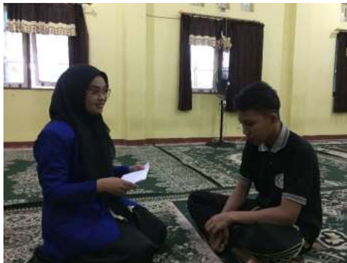
Gambar 4.5: Wawancara dengan remaja LKSA Sentosa