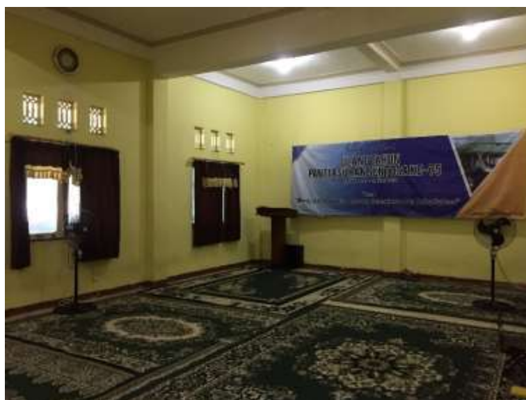
Gambar 4.2: Tempat Pelaksanaan Bimbingan Keagamaan LKSA Sentosa

terjadinya pembentukan Akhlak Al-Karimah bagi anak asuhnya. Maka dengan itu mewujudkannya dengan cara menerapkan beberapa kebijakan baik dengan cara tingkah laku yang langsung maupun teori dari Pembina/pengasuh itu sendiri.