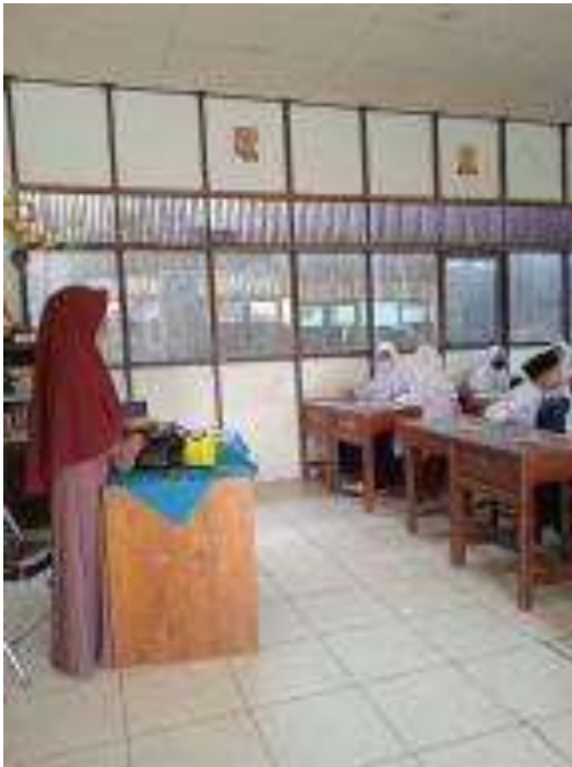
Foto Kegiatan Penelitian Tindakan Kelas