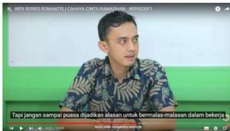
Gambar 4.11 (Episode Satu)