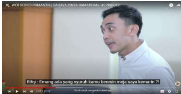
Gambar 4.13 (Episode Dua)