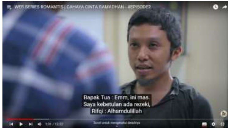
Gambar 4.12 (Episode Dua)