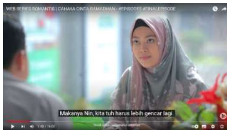
Gambar 4.16 (Episode Lima)