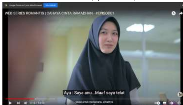
Gambar 4.9 (Episode Satu)