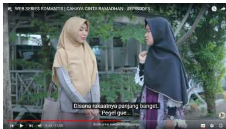
Gambar 4.14 (Episode Tiga)