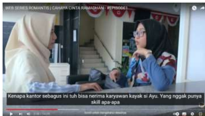
Gambar 4.10 (Episode Satu)