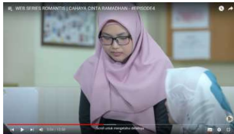
Gambar 4.15 (Episode Empat)