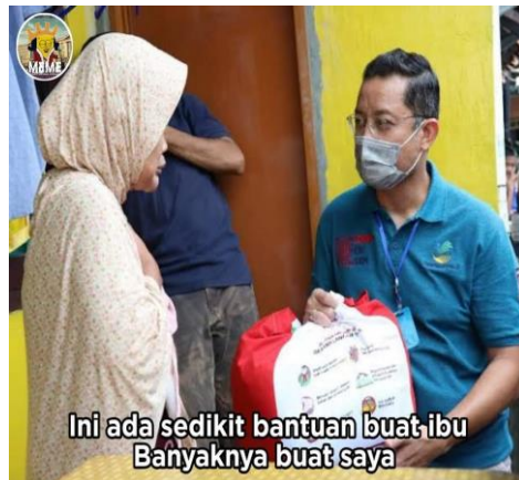
Gambar 3.5 Meme Korupsi Bansos