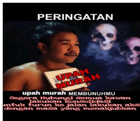
Gambar 3.15 Upah Buruh Murah

Socializing and community building adalah keinginan untuk mengidentifikasikan diri, demi menjaga dan menciptakan hubungan relasi dengan orang lain. Motif ini menciptakan topik pembicaraan, kemudian membangun interaksi sosial dalam kelompok. 79 Motif ini dapat menyasar pada hubungan masyarakat secara luas. Tujuannya adalah membangun kelompok kecil yang memiliki kesamaan hoby, pekerjaan dan lain sebagainya. Contoh meme dengan motif ini dapat dilihat sebagai berikut: