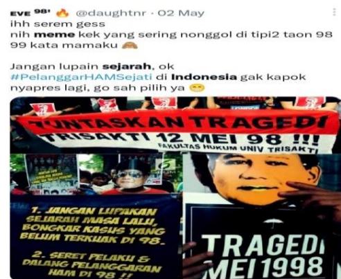
Gambar 3.10 Tragedi Trisakti 12 Mei 1998

Kedua contoh meme di atas, dapat memancing keingintahuan pembaca atau penikmat meme. Gambar 3.9 merupakan meme bertema sejarah pemerintahan Indonesia. Sedangkan gambar 3.9 adalah meme yang memuat kasus tragedi Trisaksi 12 Mei tahun 1998.