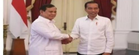
Gambar 3.4 Meme RUU Cipta Kerja

Kedua gambar di atas adalah contoh meme berbentuk juxtaposition . Terdapat perumpamaan dari keadaan sebelum dan sesudahnya. Gambar 3.3 adalah meme yang memuat kenaikan harga BBM pada dua masa pemerintahan berbeda.