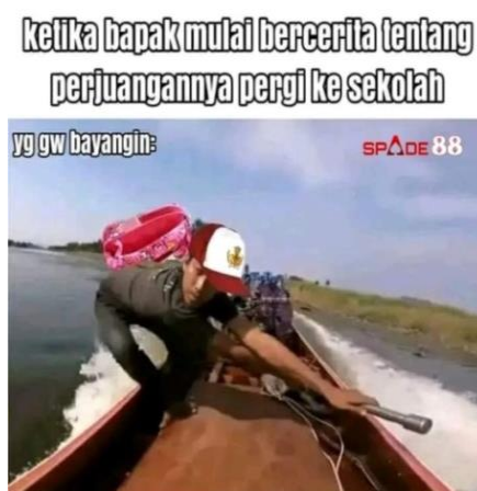
Gambar 3.19 Meme Berlogo Judi Online

Motif ekonomi adalah dorongan atau alasan untuk melakukan tindakan ekonomi. Dari segi tujuan, motif ini terbagi menjadi dua, yakni motif individu dan organisasi. Adapun dari segi bentuk, terbagi atas motif memperoleh keuntungan, motif memperoleh penghargaan, motif kegiatan sosial dan motif memperoleh kekuasaan. 81 Dalam hal ini, meme dimanfaatkan untuk memperoleh keuntungan secara pribadi maupun organisasi. Bentuknya dapat berupa logo ataupun nama situs tertentu yang termuat dalam gambar meme.