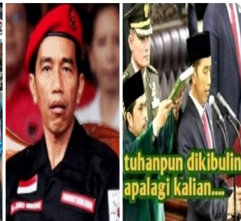
Gambar 3.6 Meme Jokowi Plongo-plongo

Kedua gambar di atas merupakan moment pejabat publik yang tersorot kamera lalu dijadikan meme. Gambar 3.5 adalah sosok mantan Menteri Sosial, Julianto Alim. Momen itu diabadikan sebelum ia terjerat kasus korupsi. Kemudian gambar 3.6 adalah momentum Presiden Jokowi sedang melongo dan ketika ia disumpah jabatan.