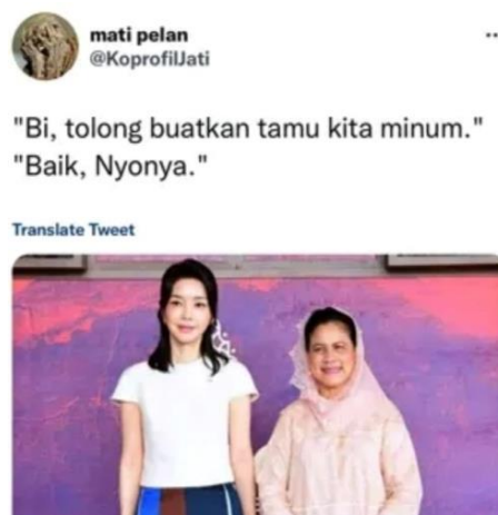
Gambar 3.1 Sindiran kepada Ibu Negara

Unsur content atau konten dalam KBBI diartikan sebagai informasi yang tersedia pada media ataupun produk elektronik. 74 Tolak ukur penilaian terhadap unsur ini dapat ditinjau berdasarkan semua aspek yang ditampilkan, mencakup penggunaan gambar dan isi tulisan. Penempatan posisi tulisan tidak selalu berada dalam satu bingkai gambar, namun bisa berada pada caption atau judul halaman. Unsur content dapat dilihat pada contoh postingan media sosial di bawah ini: