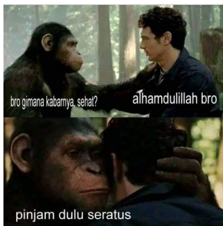
Gambar 3.13 Meme Pinjam Uang