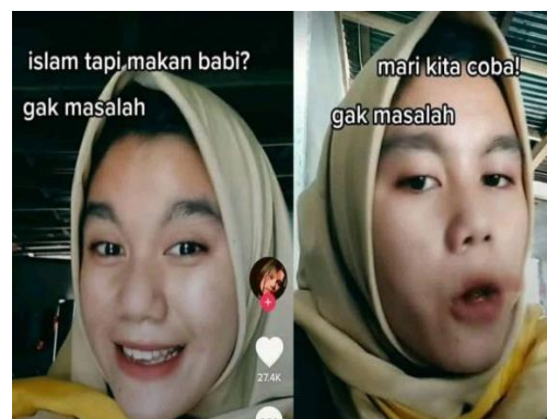
Gambar 3.18 Wanita Berhijab Makan Babi

Kedua gambar di atas adalah contoh meme bermotif self expression . Gambar 3.17 mengekspresikan pengalaman tidak enak ketika puasa Ramadan. Sedangkan gambar 3.18 merupakan ungkapan dan ekspresi wanita berhijab yang mencoba makan babi.