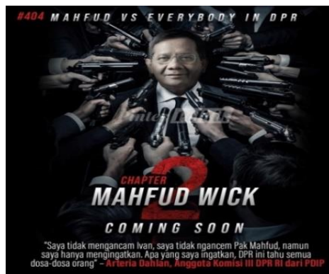
Gambar 3.11 Mahfud Versus Everybody

Meme bermotif hiburan mengusung suatu fenomena atau hal lumrah yang terjadi di masyarakat, kemudian dikemas ulang dengan nuansa lucu. Contohnya dapat dilihat pada meme di bawah ini :