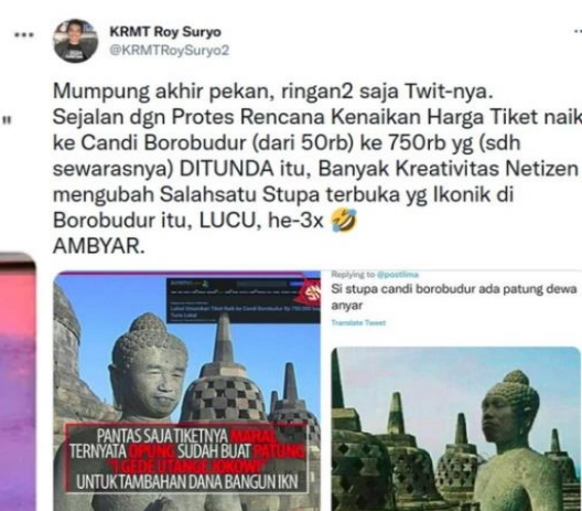
Gambar 3.2 Meme Stupa Bobobudur

Kedua gambar di atas adalah contoh meme yang dapat dilihat dari unsur content . Berisi caption, gambar dan tulisan dalam muatan meme di