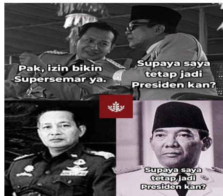
Gambar 3.9 Meme Supersemar

menarik partisipasi pengguna media sosial. 77 Tujuan utama dari motif ini adalah sebagai edukasi dan informasi. Adapun contoh meme bermotif informativeness dapat dilihat pada gambar di bawah ini: