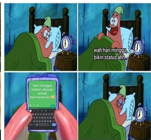
Gambar 3.14 Meme Hari Minggu

Keempat gambar di atas merupakan meme dengan motif hiburan. Gambar 3.11 dan gambar 3.12 bernuansa hiburan secara politik. Kesan lucu hanya berlaku bagi sejumlah pihak dan orang tertentu saja. Sedangkan gambar 3.13 dan gambar 3.14 merupakan meme hiburan yang bersifat ringan, sehingga semua pihak dapat mengerti letak kejenakaan dalam meme tersebut.