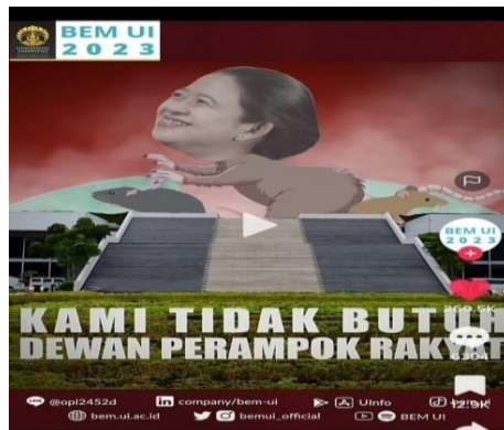
Gambar 3.7 Puan Berbadan Tikus