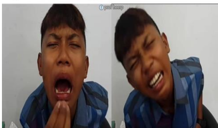
Gambar 3.17 Meme Puasa