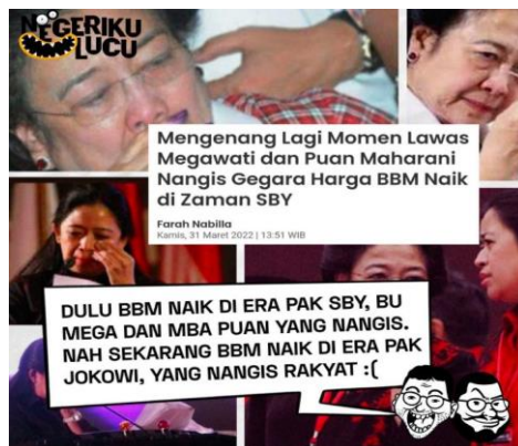
Gambar 3.3 Meme Kenaikan Harga BBM