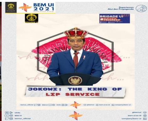
Gambar 3.8 The King of Lip Service

Kedua gambar meme di atas, ditujukan sebagai kritik kepada pemerintah. Sejumlah kebijakan dinilai merugikan masyarakat dan mementingkan pihak tertentu. Gambar 3.7 memuat sosok ketua DPR RI, Puan Maharani berbadan tikus dan gambar 3.8 adalah sosok Presiden Jokowi yang digambarkan sebagai “The King Of Lip Service.”