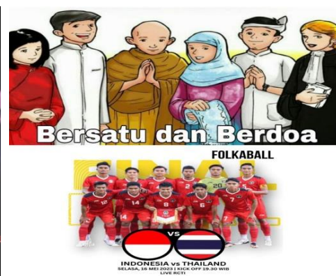
Gambar 3.16 Sea Games Kamboja 2023

Kedua gambar di atas merupakan meme yang mengusung motif socializing and community building , meme ini dibangun atas dasar kesamaan nasib, pekerjaan dan dukungan. Gambar 3.15 berisi konsolidasi terhadap kelompok buruh untuk turut melakukan demo. Sedangkan gambar 3.16 adalah meme yang mengajak masyarakat Indonesia bersatu mendukung timnas Indonesia melawan timnas Thailand.