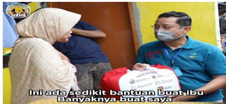
Gambar 4.7 Meme Korupsi Bansos

Gambar 4.7 adalah salah satu contoh meme yang menyindir sosok Juliari Batubara. Momen itu ketika ia membagikan bansos ke masyarakat disunting ulang dengan tulisan “Ini ada sedikit bantuan buat ibu banyaknya buat saya.” Meme itu menyinggung, dana yang harusnya diberikan penuh kepada masyarakat justru dikorupsi. Di mana setiap paket bansos dipotong Rp10.000 per paketnya dari nilai Rp300.000. 89