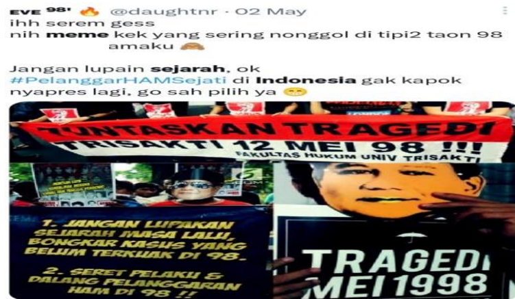
Gambar 4.14 Tragedi Trisakti 12 Mei 1998

Gambar 4.14 memuat kasus pelanggaran HAM, terdapat seruan “TUNTASKAN TRAGEDI TRISAKTI 12 MEI 1998.” Meme ini mencoba menggiring opini masyarakat dan menghubungkannya dengan salah satu calon presiden di Pilpres 2024. Terpampang wajah Prabowo Subianto pada muatan gambar, seolah ia adalah orang yang terlibat. Belum dapat dipastikan kebenaran terkait isu tersebut karena kasusnya belum tuntas sampai saat ini. 94