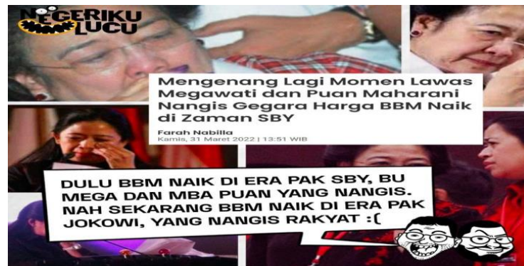
Gambar 4.8 Meme Kenaikan Harga BBM

Gambar 4.8 adalah meme Puan Maharani bersama Megawati. Meme ini dilatar belakangi kebijakan Presiden Jokowi atas kenaikan BBM pada 3 September 2022. Meme ini membandingkan era Presiden SBY tahun 2013, di mana Megawati mengerahkan anggota Fraksi PDIP di DPR, bahkan sampai ada yang turun ke jalan untuk menolak kenaikan BBM. 91