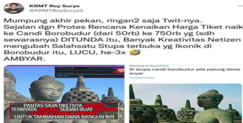
Gambar 4.15 Meme Stupa Bobobudur

Gambar 4.15 adalah meme Stupa Borobudur yang telah diedit mirip wajah Presiden Jokowi. Terdapat caption mengenai kenaikan harga tiket yang dihubungkan dengan pendanaan IKN. Meskipun ditujukan sebagai kritik namun muatannya sensitif, mengingat Candi Borobudur merupakan salah satu monumen Buddha terbesar di dunia, sedangkan Stupa adalah simbol penyimpanan abu jenazah Buddha Ghautama. 95 Meme ini diunggah ulang oleh Roy Suryo pada akun Twitternya. Hingga pada 20 Juni 2022 Roy dilaporkan oleh organisasi Dharma Nusantara.