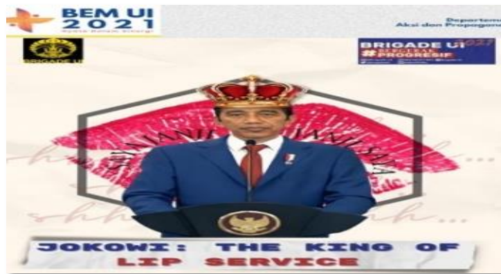
Gambar 4.20 Jokowi The King of Lip Service

Gambar 4.20 adalah meme yang ditujukan sebagai sindirian kepada Presiden Jokowi. The King of Lip Service atau raja basa-basi. Sebuah perumpamaan terhadap pernyataan dan kebijakan yang tidak sejalan. Salah satu kebijakan yang disorot adalah terkait kedudukan Komisi Pemberantasan Korupsi. Meme itu mengkritik pemerintah terkait revisi UU KPK yang dinilai justru melemahkan lembaga tersebut.