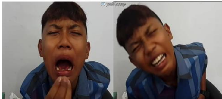
Gambar 4.5 Meme Puasa (Sumber: Facebook.com/prof heerp)

Gambar 4.5 merupakan meme yang mengilustrasikan momen saat puasa Ramadan. Pembuat meme membagikan pengalamannya ketika sahur makan mie instan dan di jam sembilan pagi perut sudah terasa lapar. Terdapat gambar wajah yang mewakili ekspresi orang sedang kelaparan. Meme ini secara tidak langsung menginformasikan, bahwa ketika sahur jangan hanya makan mie instan jika tidak ingin kelaparan.