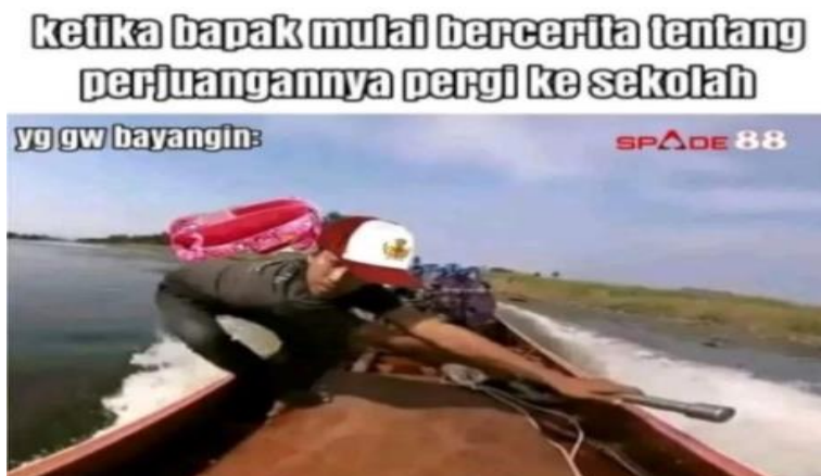
Gambar 4.18 Meme Berlogo Judi Online

Pada gambar 4.18 sekilas tidak terdapat masalah dalam muatan kontennya. Namun ada watermark bertuliskan “SPADE 88”. SPADE 88 adalah logo dari situs judi online, situs tersebut tergolong ilegal di negara Indonesia. Sejatinya pemerintah Indonesia telah resmi mengeluarkan larangan atas permainan judi sejak 1970, melalui Undang-Undang Nomor 7 tahun 1974 tentang Penertiban Perjudian. Atas dasar itulah segala praktik perjudian di Indonesia dihapus karena bertentangan dengan nilai moral, agama dan Pancasila. 99