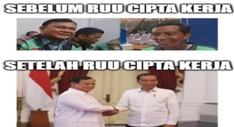
Gambar 4.9 Meme RUU Cipta Kerja

Gambar 4.9 adalah meme terkait RUU Cipta Kerja. Sebelum disahkan RUU Cipta Kerja, terdapat dua orang mengenakan pakaian ojek online . Kemudian setelah RUU Cipta Kerja disahkan, terdapat sosok Presiden Jokowi bersama Prabowo Subianto. Meme ini menyindir kebijakan pemerintah yang telah mengesahkan UU Cipta Kerja pada 5 Oktober 2020. 92 Berdasarkan isi pesannya meme ini bersifat kritik, seolah menggambarkan keadaan pihak tertentu yang akan diuntungkan setelah disahkannya RUU Cipta Kerja. Disamping itu, terdapat kesan humor atas penyandingan gambar yang memiliki kemiripan wajah .