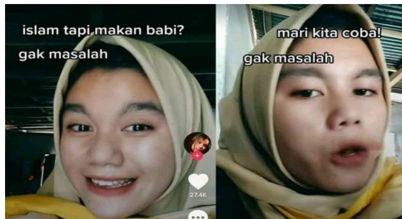
Gambar 4.12 Wanita Muslim Makan Babi

Gambar 4.12 adalah potongan video dari seorang gadis berpakaian hijab yang memakan daging babi. Cuplikan video itu menuai banyak tanggapan warganet, hingga disebar dan viral di media sosial. Sebagaimana yang telah diketahui daging babi adalah makanan yang diharamkan dalam ajaran Islam. Berdasarkan beberapa sumber yang ditemukan. Gadis berhijab ini bukanlah seorang muslim, ia penganut agama Kristen Protestan. Hal itu diungkapkan salah satu warganet yang mengunggah video lain dari gadis tersebut. 93