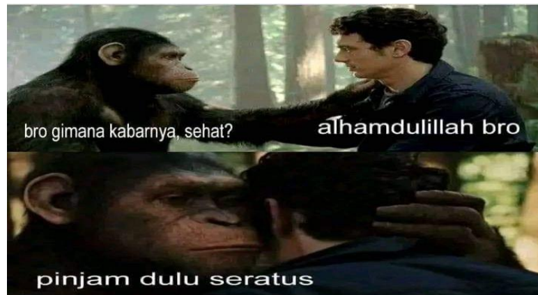
Gambar 4.3 Meme Pinjam Uang

Gambar 4.3 berisi percakapan antara manusia dengan seekor kera. Meme ini menirukan peristiwa lazim yang terjadi di masyarakat, yakni kebiasaan meminjam uang. Berawal dari kalimat basa-basi, lalu menyampaikan maksud dan tujuannya. Secara muatan, meme ini dapat memancing tawa sejumlah orang. Nilai humor yang terkandung juga dapat memberikan hiburan secara cuma-cuma. Meme ini menyindir secara halus kepada siapa saja yang terbiasa mengalami hal serupa sebagaimana yang termuat pada gambar.