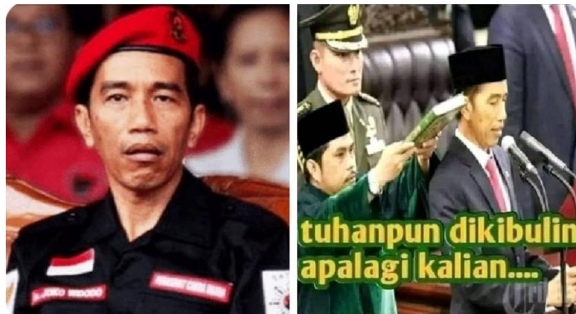
Gambar 4.13 Meme Jokowi Plongo-plongo

Gambar 4.13 merupakan meme Presiden Jokowi ketika ia melamun dan saat disumpah jabatan. Terdapat tulisan “Tuhanpun dikibulin apalagi kalian.” Meme ini berisi sindiran tulisan serta penbandingan foto, yakni momen ketika Presiden Jokowi melongo dan momen sakral ketika ia disumpah jabatan. Bentuk sindiran yang dibangun pada meme ini mengarah pada unsur kebencian, secara tidak langsung menuduhkan Presiden Jokowi telah berani berbohong atas sumpahnya hingga mengumpamakan jika tuhan saja berani untuk dibohongi apalagi rakyat.