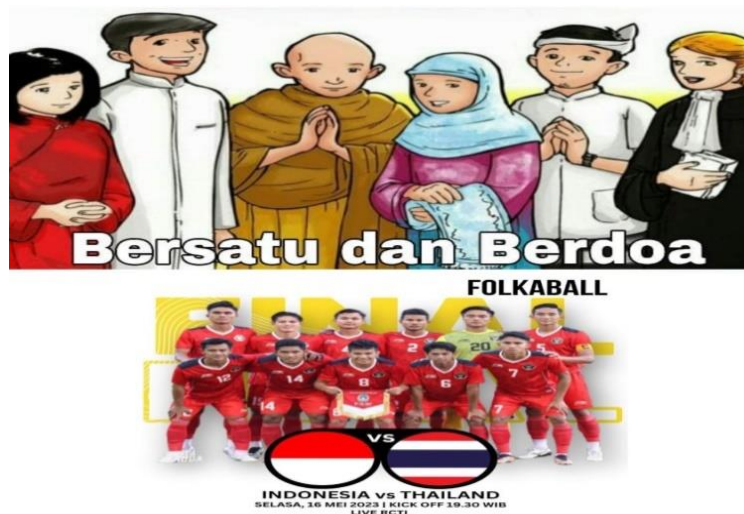
Gambar 4.2 Final Sea Games Kamboja 2023

Gambar 4.2 adalah meme berbentuk dukungan, ditujukan kepada tim nasional Indonesia pada pertandingan final sepak bola Sea Games Kamboja 2023. Pembuat meme meletakkan gambar tim nasional Indonesia dan menambahkan gambar kartun di atasnya sebagai simbol keberagaman, yang menunjukkan sosok tokoh enam agama yang ada di Indonesia, dari kiri ke kanan: Konghucu, Kristen (Protestan), Buddha, Islam, Hindu dan Katolik. Kemudian terdapat tulisan “Bersatu dan Berdoa.” Hal ini mencerminkan semboyan Bhinneka Tunggal Ika, berbeda-beda tetap menjadi satu bangsa.