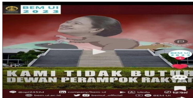
Gambar 4.19 Puan Maharani Berbadan Tikus

Gambar 4.19 merupakan cuplikan video dari meme Puan Maharani berbadan tikus. Meme itu ditujukan sebagai bentuk kritik kepada DPR, setelah mengesahkan PERPU Cipta Kerja yang dinilai inkonstitusional dan merugikan masyarakat. Aksi penolakan tersebut diekspresikan BEM UI melalui meme. Sosok Puan Maharani yang merupakan ketua DPR, digambarkan sebagai tikus yang keluar dari sarang, terdapat sindiran “KAMI TIDAK BUTUH DEWAN PERAMPOK RAKYAT.”