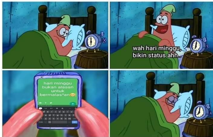
Gambar 4.4 Meme Hari Minggu

Gambar 4.4 merupakan meme yang mengilustrasikan salah satu kebiasaan sebagian pengguna media sosial di hari minggu. Pembuat meme menggunakan tokoh kartun bernama Patrik dalam serial Spengebob. Selain itu, meme ini juga menyindir cara seorang melakukan pencitraan. Di mana aktivitas yang sedang dilakukan, tidak sesuai dengan apa yang ia tulis pada akun media sosialnya. Patrik digambarkan menulis status di media sosialnya yang seolah-olah mencitrakan dia akan bekerja keras di hari libur, padahal setelah menulis hal tersebut ia justru tidur.