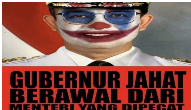
Gambar 4.17 Meme Joker Anies

Gambar 4.17 merupakan meme Anies Baswedan, wajahnya dibuat sedemikian rupa hingga menyerupai karakter Joker. Terdapat tulisan yang menyindir kedudukan Anies Baswedan. Pada dasarnya meme ini ditujukan sebagai bentuk kritikan kepada Gubernur Jakarta Anies Baswedan. Meme ini diunggah oleh Ade Armando pada akun Facebook pribadinya, setelah dilaporkan ke Polisi, ia memberi pengakuan bahwa bukan dia yang membuat meme tersebut. 98