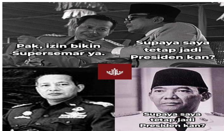
Gambar 4.1 Meme Supersemar

Gambar 4.1 adalah meme bertema sejarah, terdapat 3 foto dalam satu bingkai. Sosok dalam gambar itu adalah Soekarno dan Soeharto, mereka merupakan tokoh pahlawan sekaligus presiden pertama dan kedua negara Republik Indonesia. Meme ini mengilustrasikan Supersemar atau surat perintah 11 Maret 1966 yang merupakan kejadian penting dan bersejarah. Supersemar menjadi tanda perpindahan model pemerintahan orde lama ke orde baru. Orde lama yang dipimpin oleh Soekarno pada akhirnya digantikan oleh Letjen Soeharto. 86