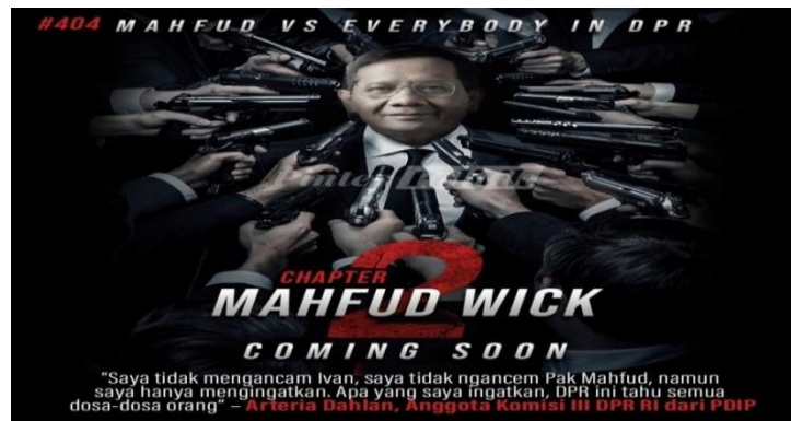
Gambar 4.6 Mahfud Versus Everybody

Gambar 4.6 adalah meme parodi saat diselenggarakannya rapat dengar pendapat pada Rabu 29 Maret 2023. Rapat itu membahas terkait dana mencurigakan di Kemenkeu mencapai Rp 300 triliun. 88 Ada beberapa kejadian yang disoroti publik, salah satunya adalah perdebatan yang terjadi antara Mahfud dengan Komisi 3 DPR RI. Aksi itu lantas diparodikan layaknya film John Wick: Chapter 2. Karakter John Wick berasal dari film aksi laga di mana tokoh utamanya yang ahli beladiri harus menghadapi orang-orang yang ingin menghabisinya.