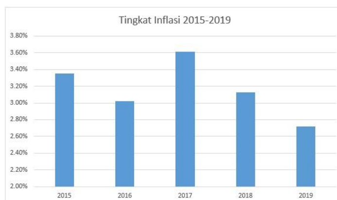
Gambar 1.1 Tingkat Inflasi

Salah satu jenis investasi yang sekarang ini diminati oleh masyarakat ialah investasi emas. Investasi ini merupakan jenis investasi yang dapat membuka peluang bahwa dengan berinvestasi emas dapat memberikan keuntungan atau imbal dan hasil yang melebihi investasi yang berisiko tinggi dan kondisi yang memungkinkan seperti lonjakan naiknya harga emas dunia dan terjadinya inflasi. Selain itu, investasi emas disebut juga sebagai jenis investasi yang paling aman jika dibandingkan dengan jenis investasi lain (Mohammad, 2014, hlm. 16).