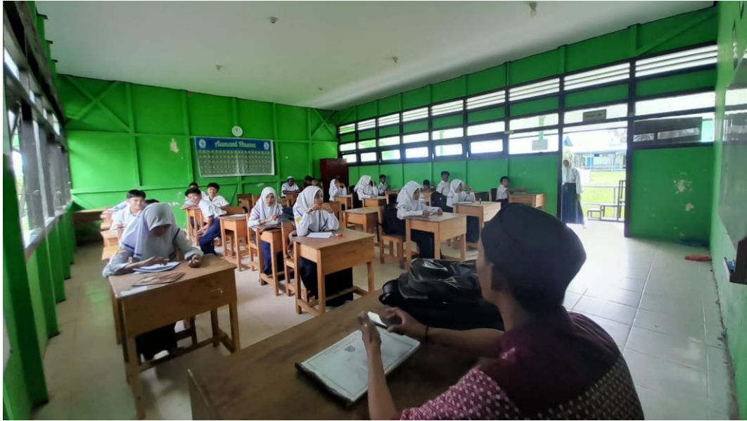
Gambar 3. Sesi Pretest