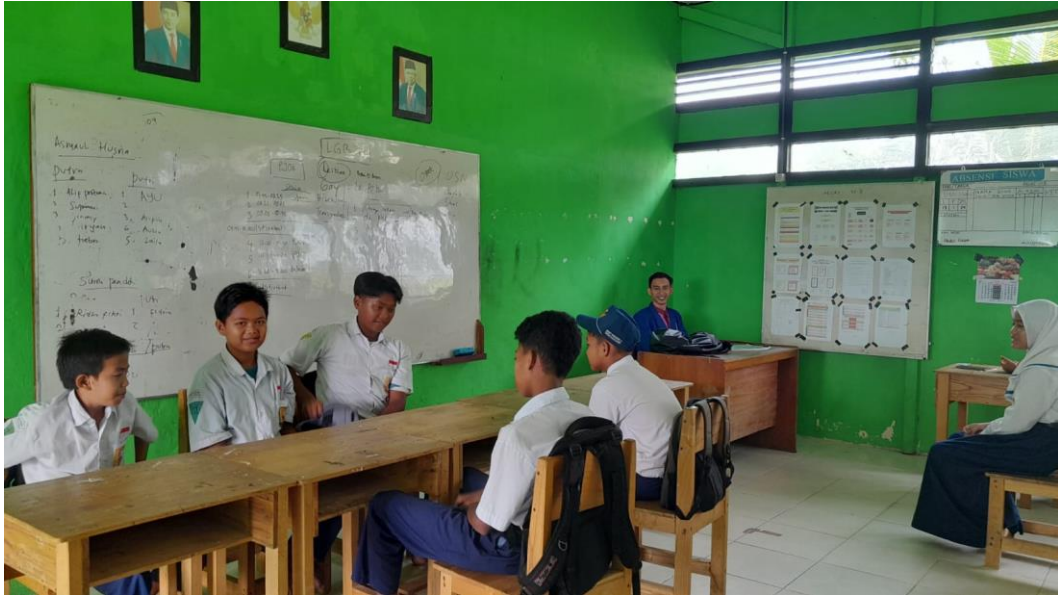
Gambar 5.1 Kegiatan kelas