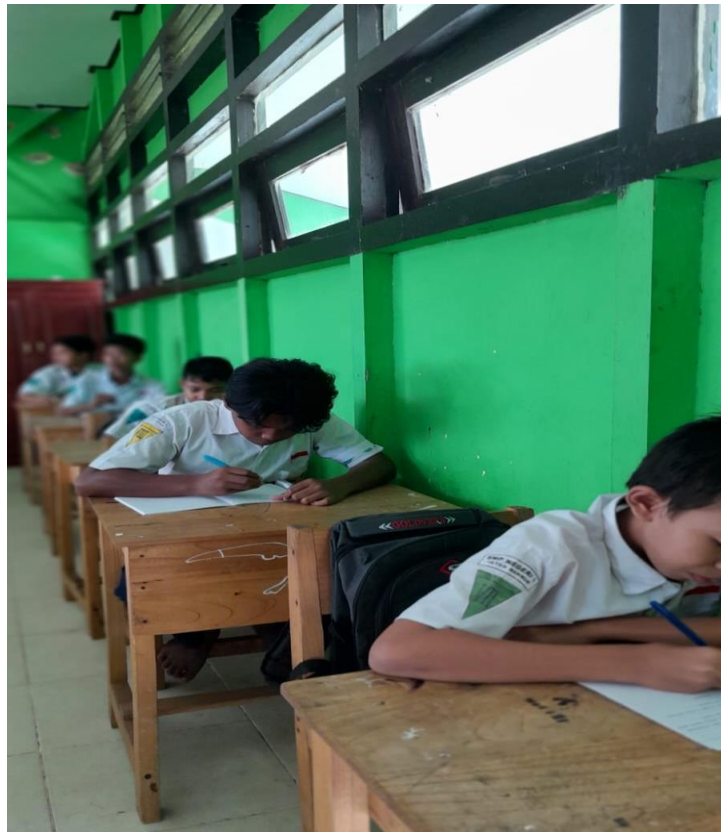
Gambar 4. Sesi Posttest