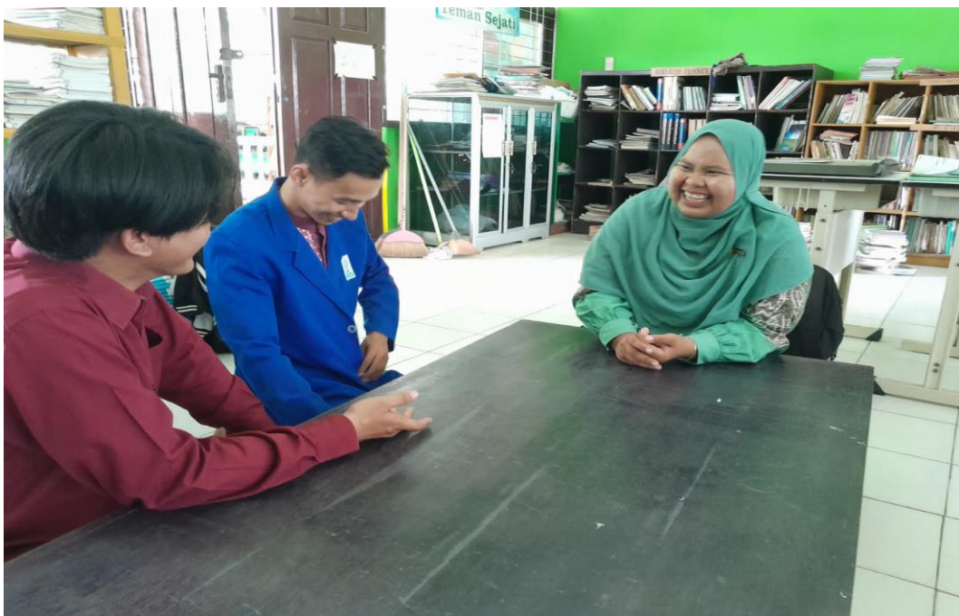
Gambar 2. Sesi wawancara