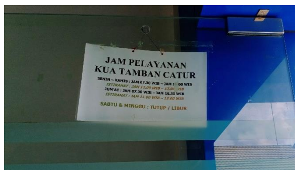
Sumber data: Dokumentasi Peneliti