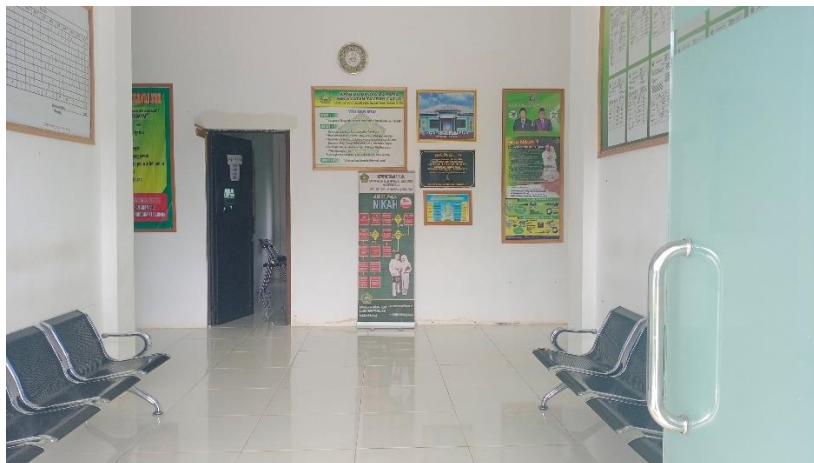
GAMBAR 4.4 Ruang tunggu di Kantor Urusan Agama Kecamatan Tamban Catur