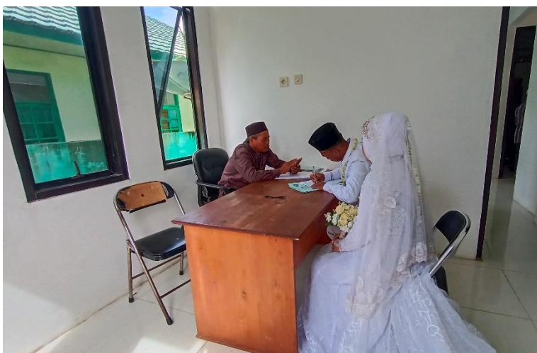
Sumber data: Dokumentasi Peneliti