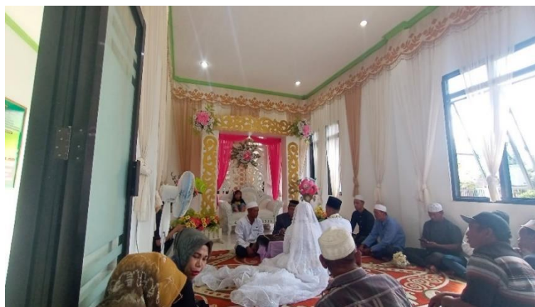
Sumber data: Dokumentasi peneliti