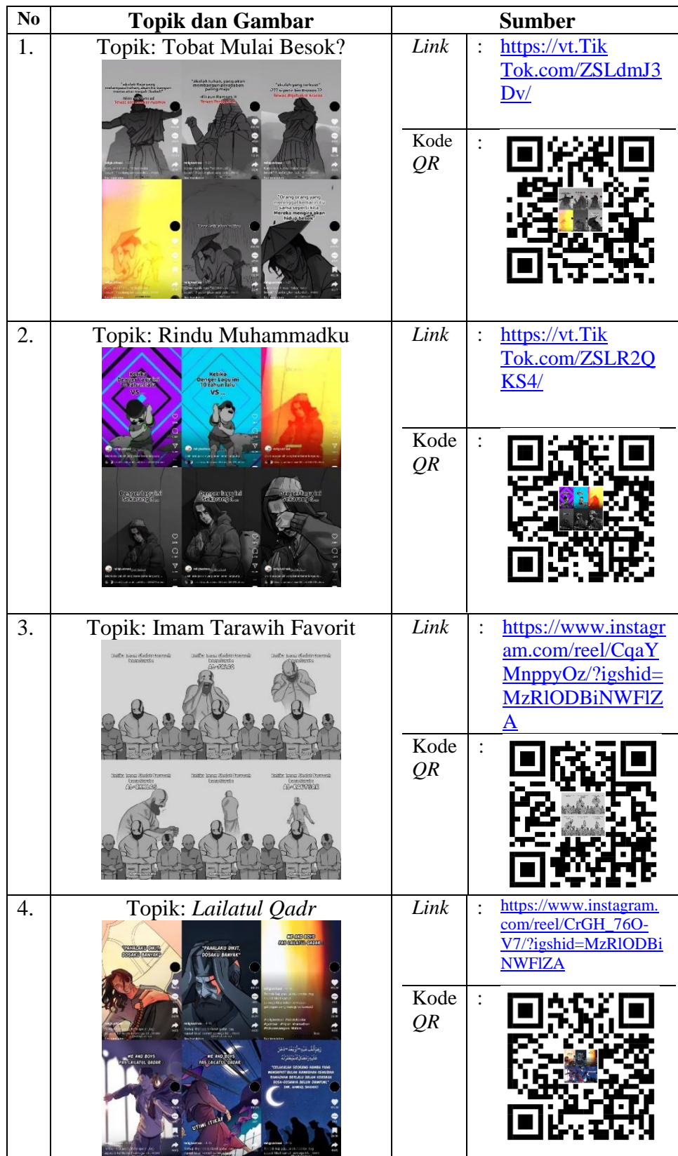
Tabel 11 Dokumentasi Digital Storytelling Islami @Religiustrasi