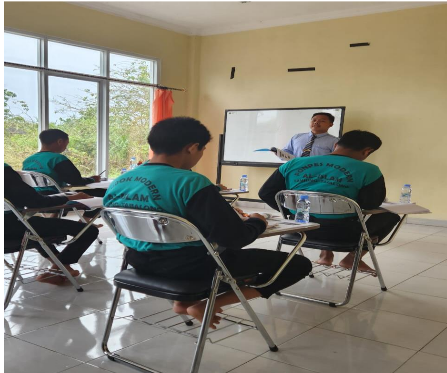
Gambar 4.3 Penyampaian Materi Manajemen dari tim BPUP

(Sumber data : Dokumentasi Pondok Pesantren Teknologi Pertanian Al-Islam: Tahun 2023)