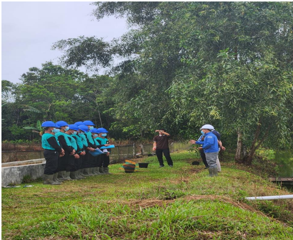
Gambar 4.4 Pelatihan dan Recruitment Santri