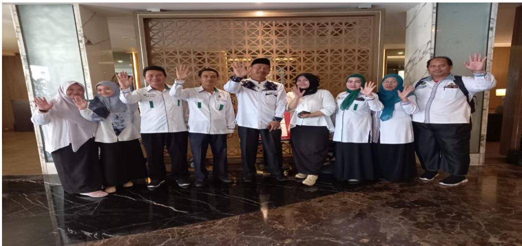
Foto bersama Kepala Seksi dan Staf PHU Kementerian Agama Kota Banjarmasin dalam rangka manasik haji hari pertama dan kedua di Hotel Nasa Banjarmasin