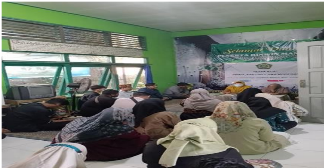
Penasehatan dari Puskesmas