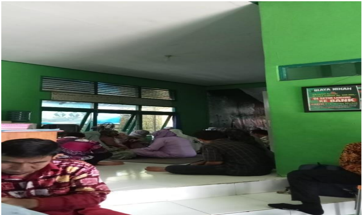
Pelaksanaan Pernikahan di Balai KUA Kecamatan Banjarmasin Tengah