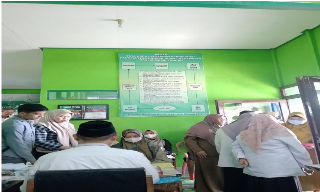
Penerimaan dan Pemeriksa berkas calon pengantin