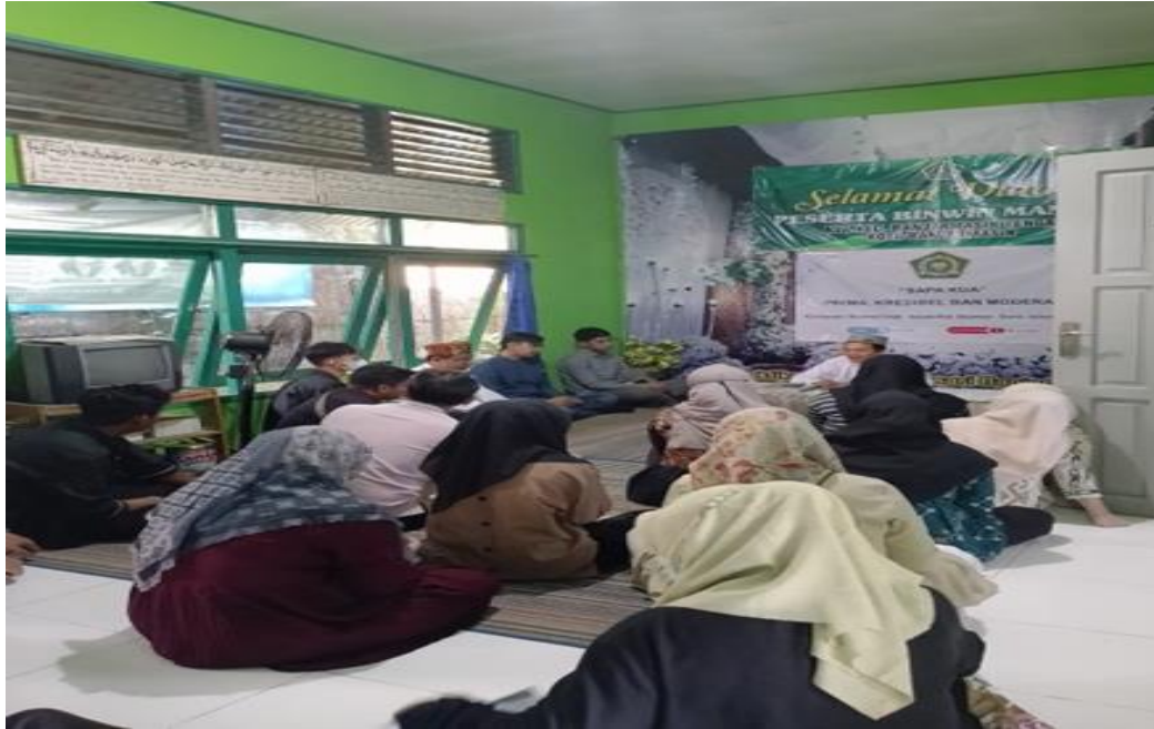
penasehatan bimbingan dari KUA Kecamatan Banjarmasin Tengah