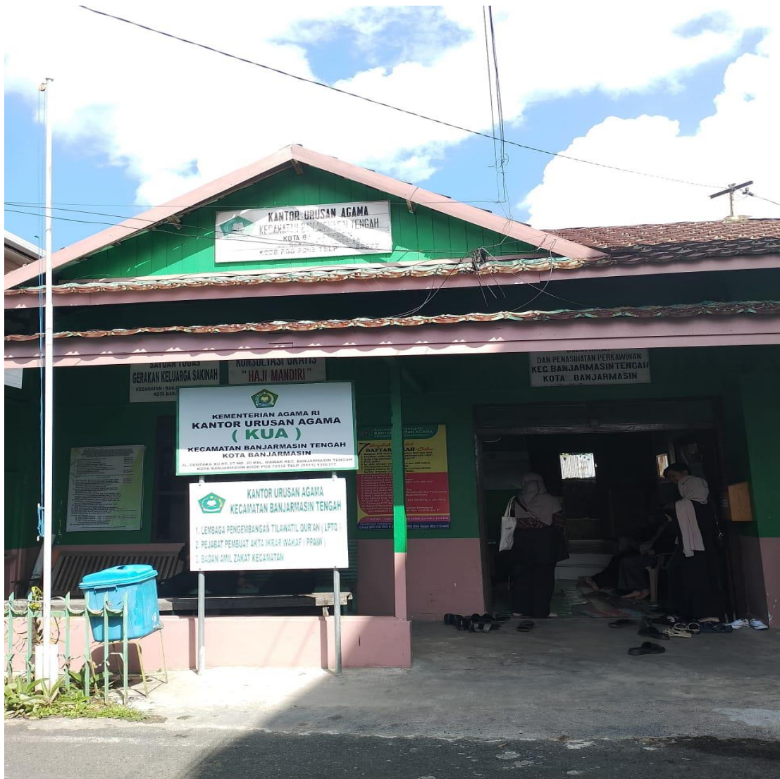
Kantor Urusan Agama Kecamatan Banjarmasin Tengah