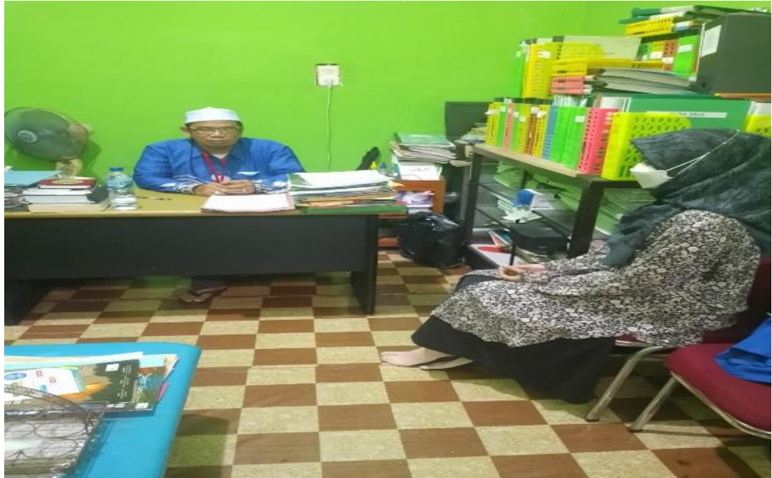
Wawancara dengan Kepala KUA Kecamatan Banjarmasin Tengah