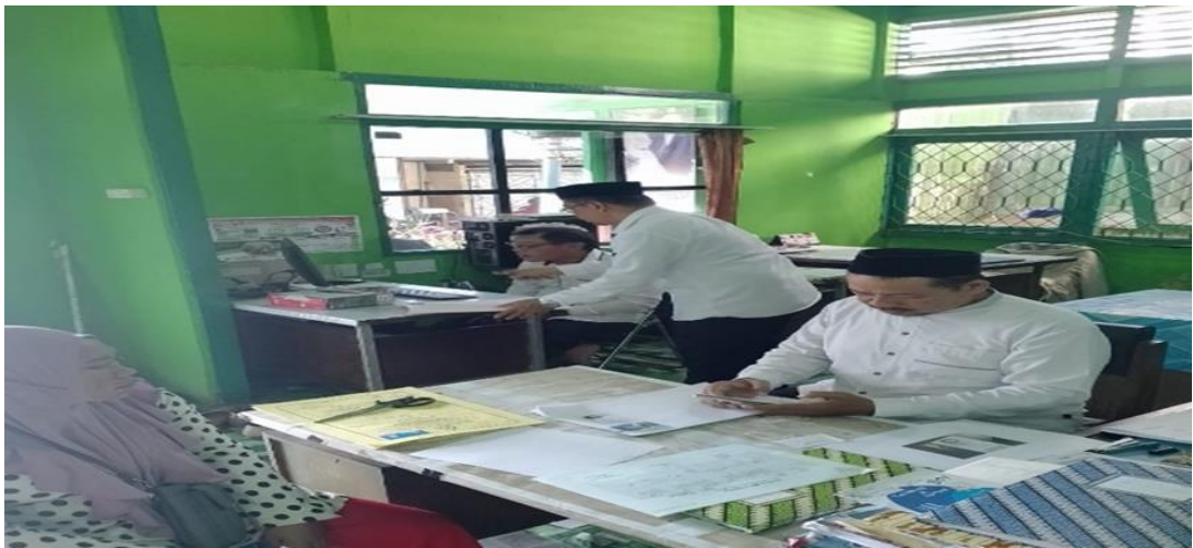
Pemasukan data calon pengantin melalui Web SIMKAH