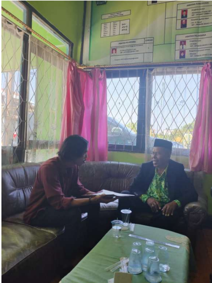
G.3: Wawancara dengan Kepala KUA Kecamatan Tamban