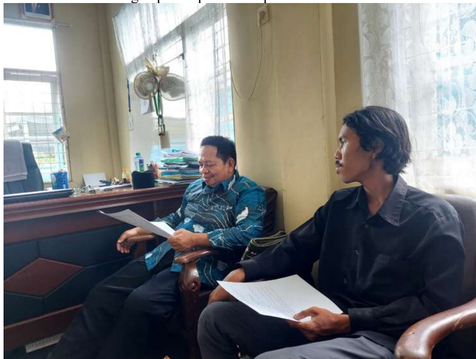
G.5: Wawancara dengan Kepala KUA Kecamatan Marabahan