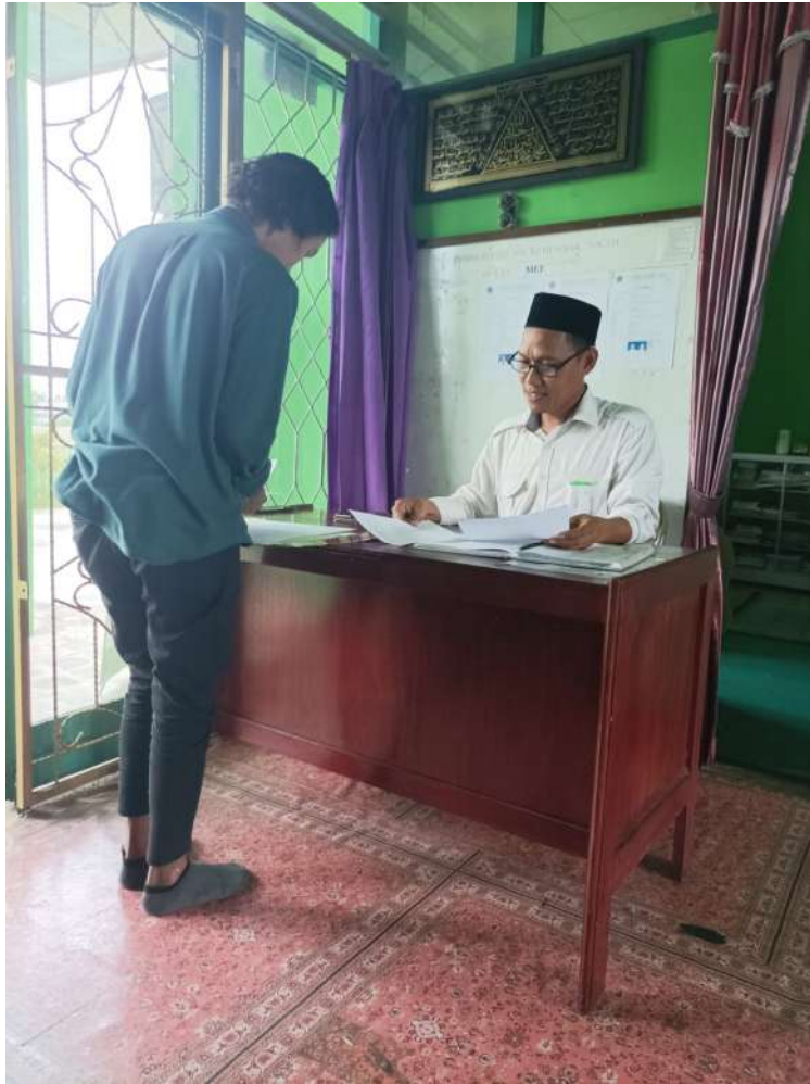
G.2: Wawancara dengan Kepala KUA Kecamatan Mekarsari