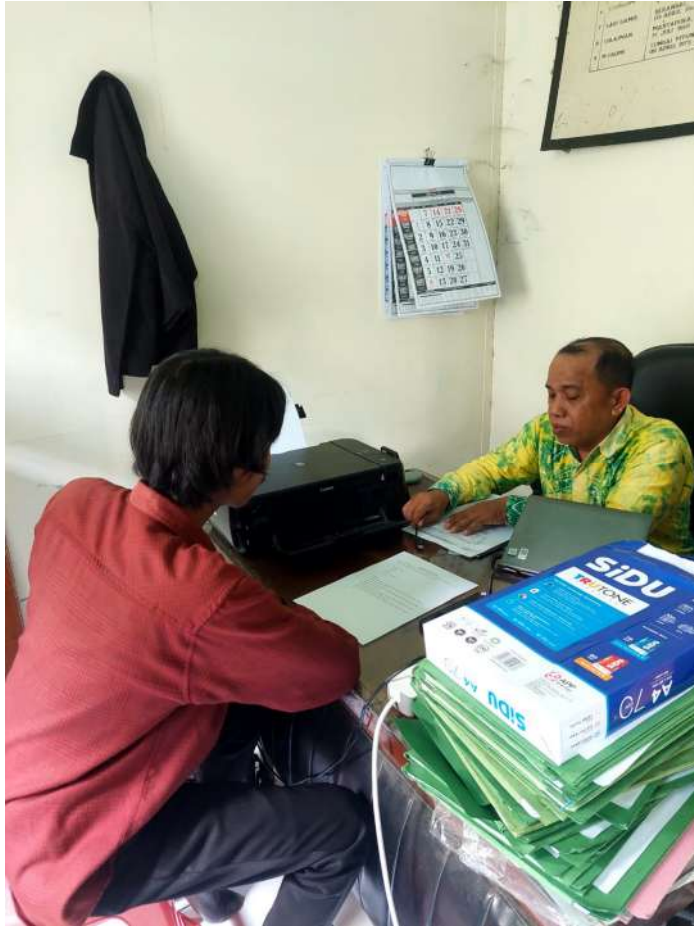
G.1 : Wawancara dengan Kepala KUA Kecamatan Alalak