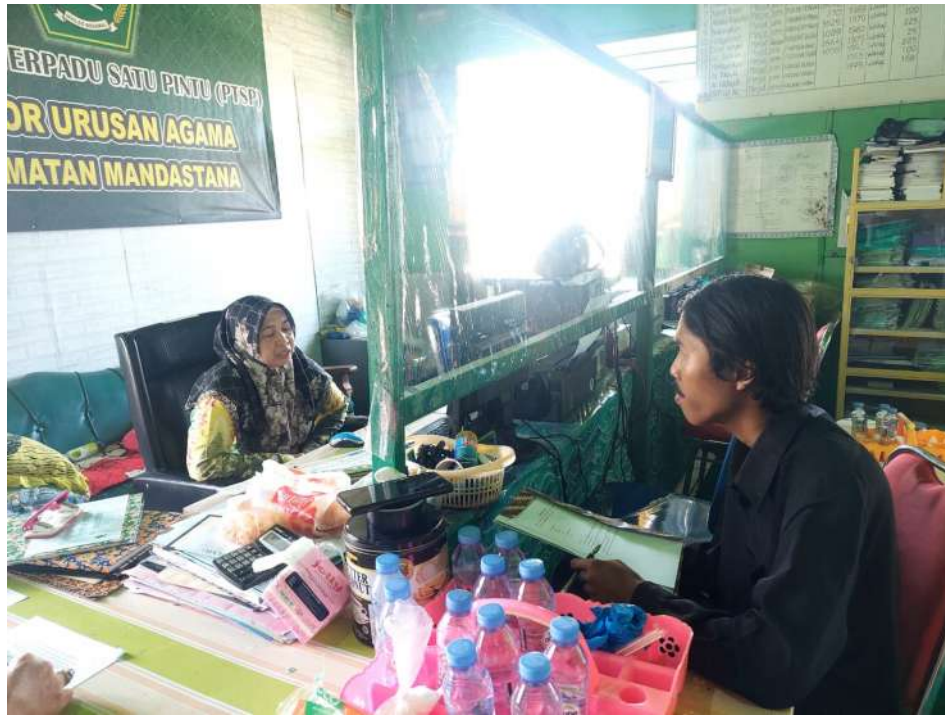
G.4: Wawancara dengan plt. Kepala dan Operator KUA Kecamatan Mandastana