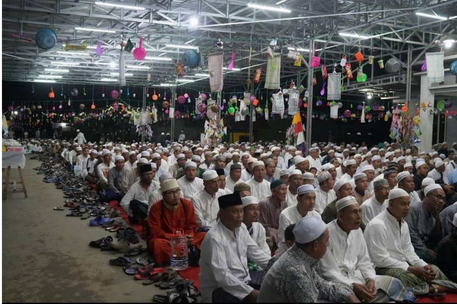
Gambar 4.13 Foto pelaksanaan peringatan Isra Miraj Muhammad SAW

Haul Guru Sekumpul, dirayakan sebagai PHBI pada Majelis ini bersangkutan dengan materi dakwah yang sering diajarkan oleh da'i dalam Majelis Taklim Ar-Raudhah. Dengan perayaan haul wali Allah ta'ala ini mampu menambah rasa cinta masyarakat kepada wali Allah ta'ala.