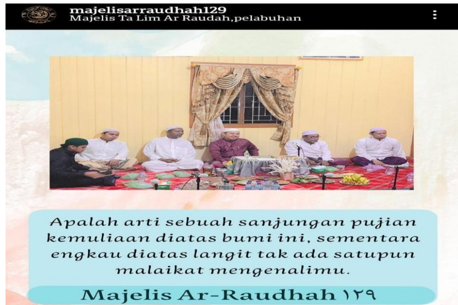
Gambar 4.15 Foto Postingan Instagram Majelis Taklim Ar-Raudhah