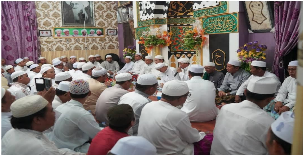
Gambar 4.2 Foto Sebelum Mempunyai Majelis Khusus

Seiring berjalannya waktu jemaah di majelis ini terus bertambah dari usia muda sampai lanjut usia terus berdatangan hingga saat ini jumlah jemaah di majelis taklim ar-raudhah berjumlah 3000 orang dimana jemaah yang hadir bukan hanya di desa sejahtera saja, tetapi berbagai macam desa ikut berhadir dalam pengajian rutin majelis. Hingga sampai saat ini majelis taklim ar-raudhah belum bisa memperluas wilayah majelis taklim karena kekurangan dana. 38