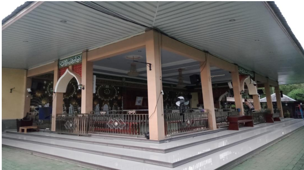
Gambar 4.3 Foto Majelis Taklim Ar-Raudhah