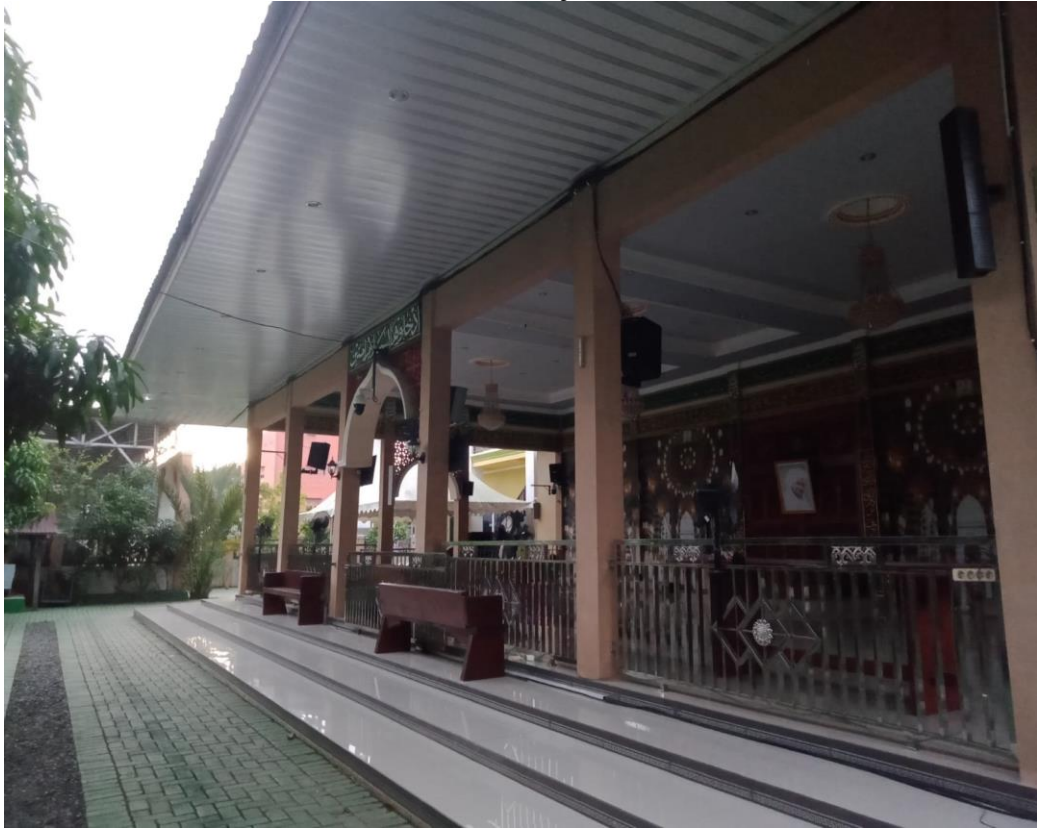
Gambar 4.8 Foto Halaman Area Majelis Taklim