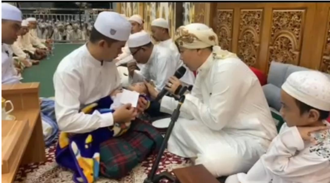
Gambar 4.5 Foto Tasmiyah Anak

Majelis Taklim Ar-Raudhah menjadi tempat perkumpulan para ulama dan habaib yang diselenggarakan setiap tahun. Para ulama dan habaib berkumpul bertujuan untuk menjalin silaturahmi agar para ulama dan habaib di Kalimantan khususnya Kalimantan Selatan bisa mempererat tali persaudaraan dan menjaga hubungan baik sesama umat muslim. Peran ulama dan habaib sangat mempengaruhi di kehidupan kita, karena mayoritas penduduk kita beragama Islam oleh karena itu wajib bagi kita untuk mencintai dan menyayangi para ulama dan habaib. Habaib ini adalah salah satu keturunan Nabi Muhammad SAW. Mencintai dan memuliakan ahlu bait Rasulullah SAW hukumnya wajib. Orang-orang yang memuliakan keturunan Nabi SAW akan mendapatkan ganjaran dan balasan dari Allah SWT dan Nabi Muhammad SAW.