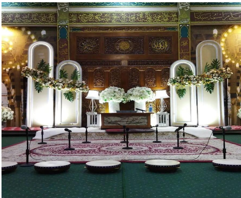
Gambar Foto 4.4 Persiapan Pembacaan Maulid Habsyi

Majelis ini sering juga melaksanakan tasmiyah seorang bayi dan juga sering melaksanakan akad nikah. Pelaksanakan pernikahan tersebut setelah pembacaan kitab berakhir, kemudian di lanjutkan untuk pembacaan akad nikah.