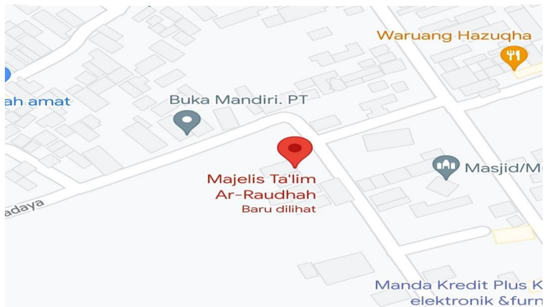
Gambar 4.1 Peta Letak Majelis Taklim Ar-Raudhah

Kabupaten Tanah Bumbu merupakan kabupaten pemekaran dari Kabupaten Kotabaru yang ditetapkan berdasarkan Undang-undang Nomor 2 Tahun 2003 tanggal 8 April 2003 tentang Pembentukan Kabupaten Tanah Bumbu dan Kabupaten Balangan di Provinsi Kalimantan Selatan. Berdasarkan undang-undang tersebut, Kabupaten Tanah Bumbu selalu merayakan hari jadinya pada tanggal 8 April setiap tahunnya. Nama historis