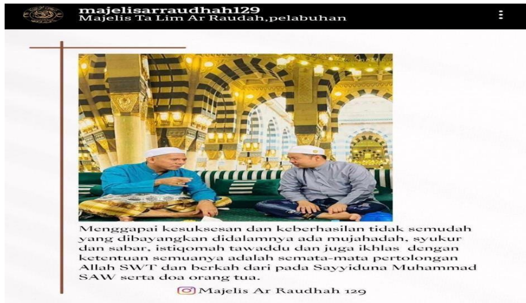
Gambar 4.14 Foto Postingan Instagram Majelis Taklim Ar-Raudhah

Majelis taklim Ar-Raudhah juga memanfaatkan insatgram ini untuk membagikan jadwal kegiatan maejelis taklim yang bertujuan untuk memudahkan para jemaah untuk mengetahui kegiatan acara Majelis Taklim. Pemanfaat media sosial sebagai sarana media dakwah juga memberikan efek positif sekaligus memberikan efek negatif bagi umat islam. Efek positif yang bisa diambil dari dakwah melalui media sosial diantaranya adalah kemudahan akses media sosial yang memungkinkan masyarakat mempelajari ajaran agama.