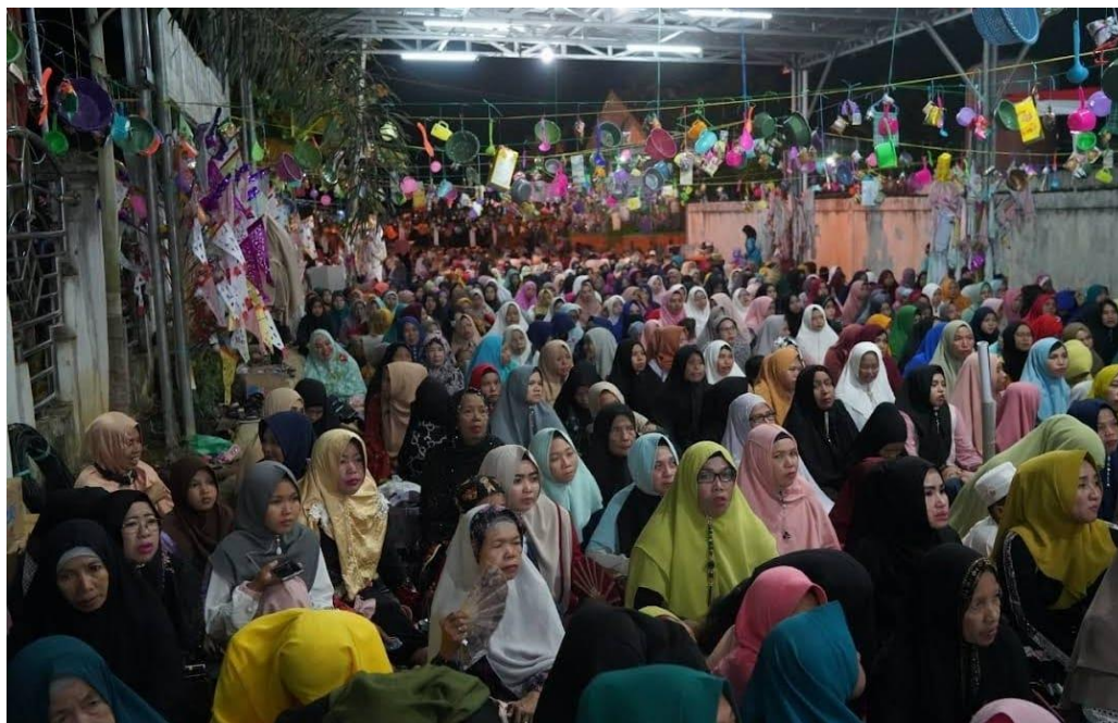
Gambar 4.12 Foto Peringatan Isra Miraj Nabi Muhammad Saw