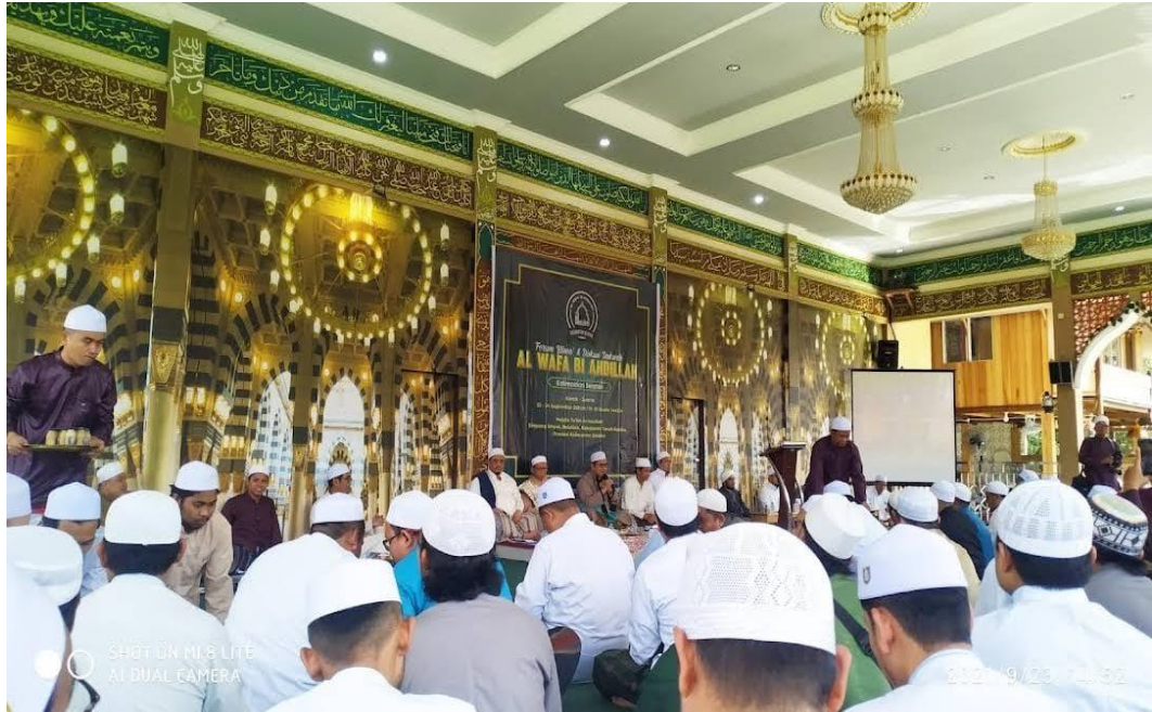
Gambar 4.6 Foto Acara Silaturahmi Ulama dan Habaib Se-Kalimantan