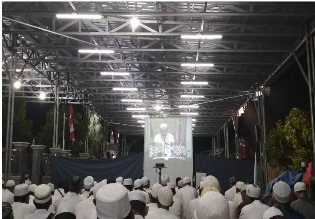
Gambar 4.10 Foto pengajian Rutin Di Majelis Taklim Ar-Raudhah

Ketika pembacaan maulid habsyi atau pembacaan burdah selesai para panitia Majelis Taklim Ar-Raudhah memberikan secangkir kopi untuk disiapkan dan diberikan kepada jemaah agar jemaah bisa menikmati ceramah agama yang disampaikan yang bertujuan untuk tetap santai dan tidak mudah mengantuk sambil mendengarkan ceramah agama yang disampaikan oleh