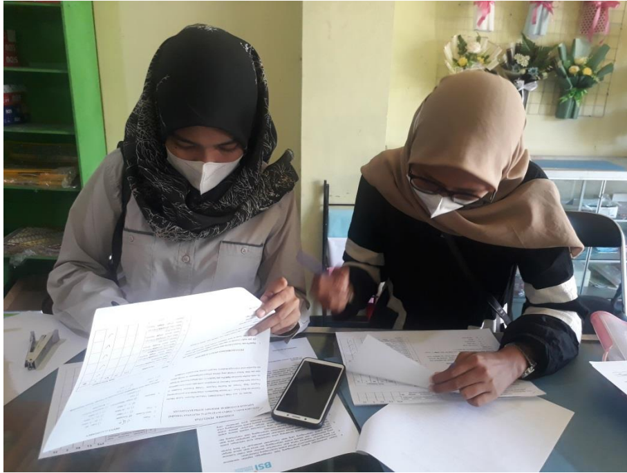
Gambar Lampiran 1 Responden Kalangan Pelajar