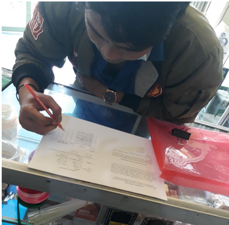
Gambar Lampiran 2 Responden Kalangan Pekerja / Karyawan