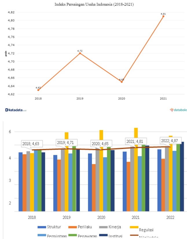
Gambar 1. 1 Indeks Persaingan Usaha Indonesia Tahun 2018 - 2022