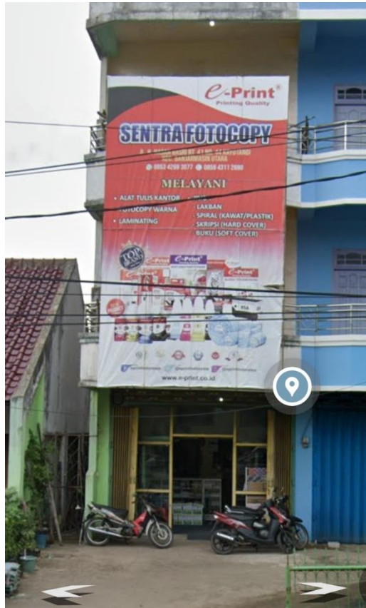
Gambar 4. 1 Fotocopy Sentra terlihat dari jalan raya