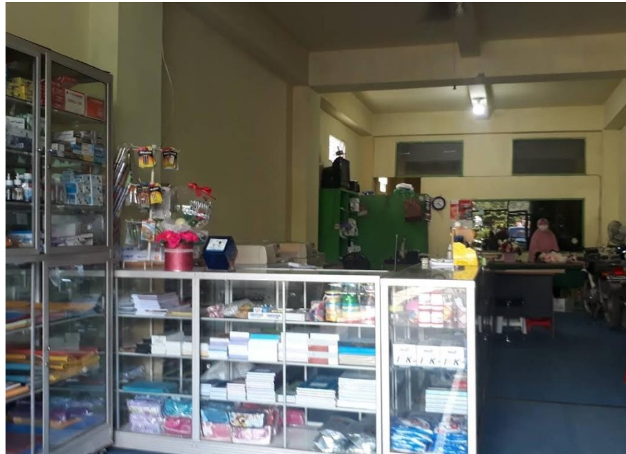
Gambar 4. 2 Fotocopy Sentra tampak dalam ruangan

berupa ruko 3 lantai yang mana pada lantai 1 adalah tempat usahanya. Fotocopy Sentra memiliki tempat area yang cukup luas dan terletak dipinggir jalan raya yang menghubungkan antara sekolahan, kampus serta perkantoran disekitaran jalan kayu tangi.