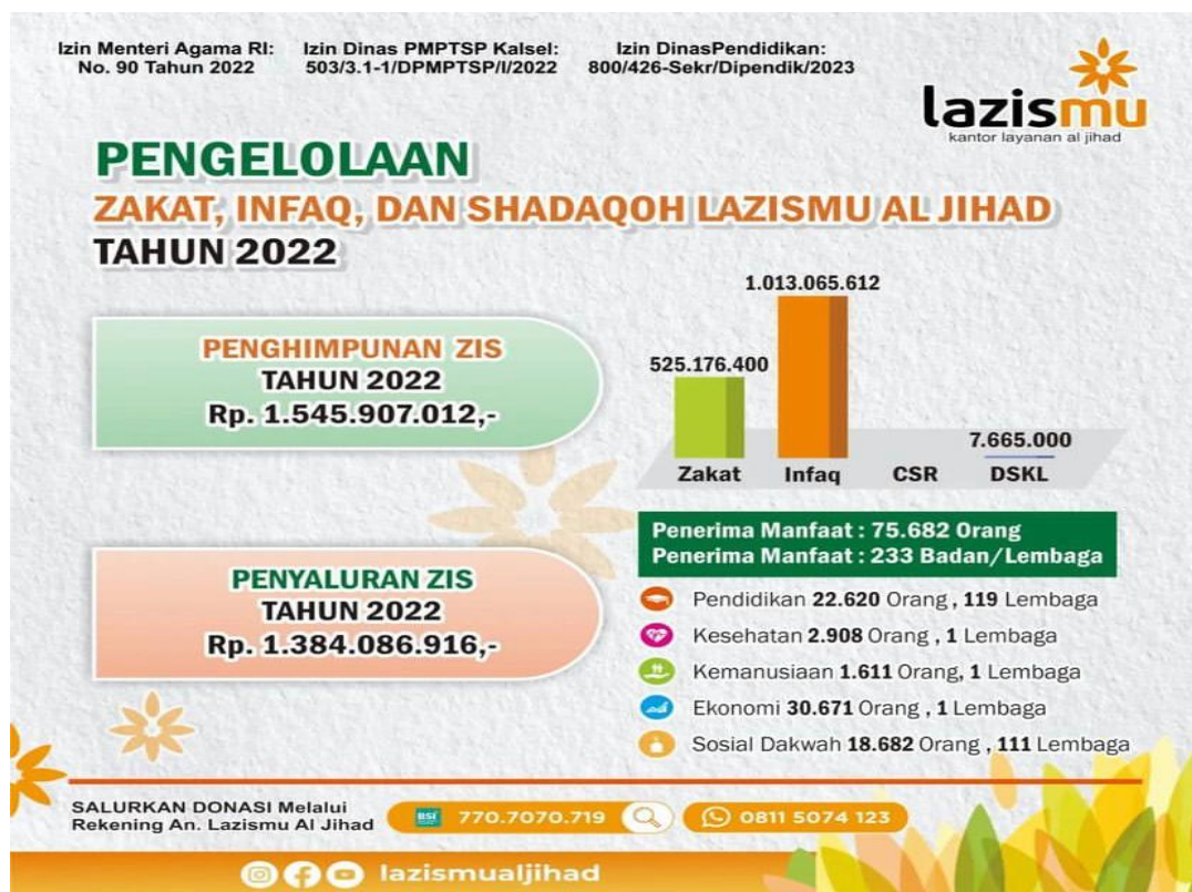
Gambar penghimpunan Infak 2021-2022

Sumber Dokumen Lazismu Al Jihad (Data diolah)