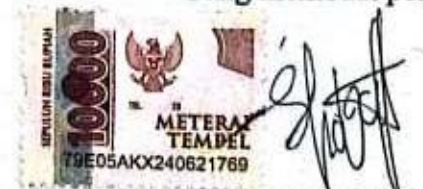
Nurus Sobah Sofia