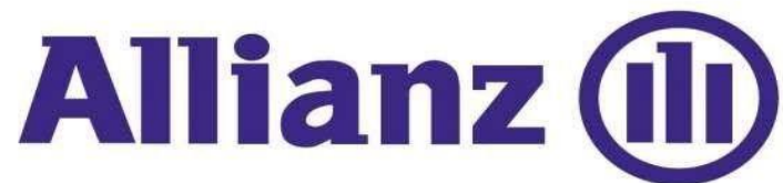
Gambar 4.1 Logo Allianz Cabang Banjarmasin