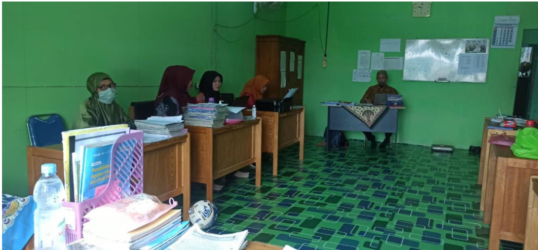
Lampiran 1. Dokumentasi Sekolah