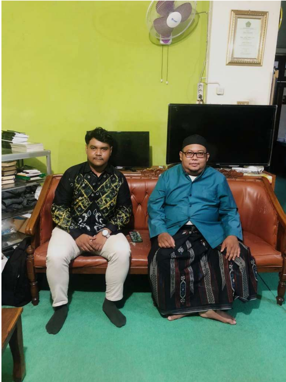
Gambar 2: Wawancara dengan Ulama Nahdlatul Ulama