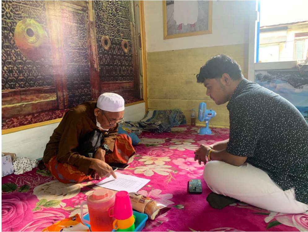
Gambar 1: Wawancara dengan Ulama Nahdlatul Ulama