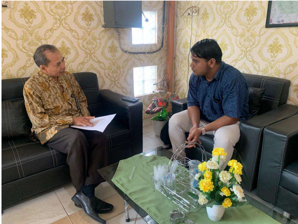
Gambar 3: Wawancara dengan Ulama Muhammadiyah