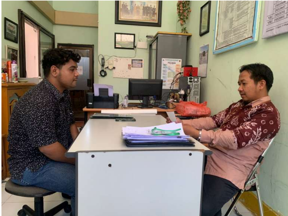
Gambar 4: Wawancara dengan Ulama Muhammadiyah