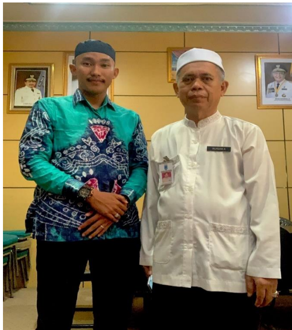
Foto bersama Ketua LPTQ Kabupaten Banjar