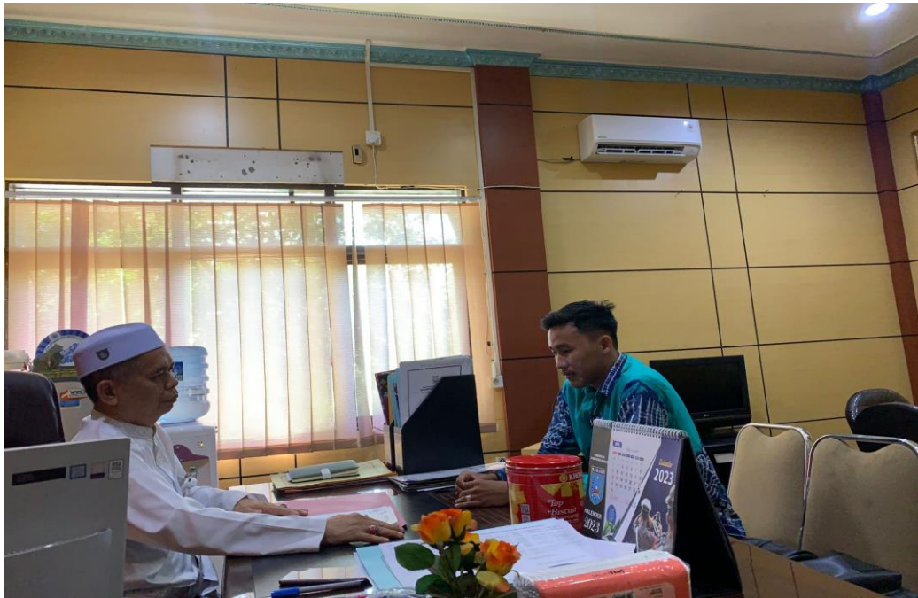
Wawancara dengan ketua LPTQ Kabupaten Banjar