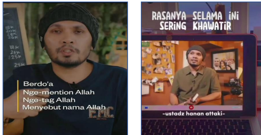
Gambar 4.3. Kajian ustadz Hanan Attaki, Lc