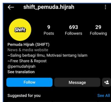
Gambar 4.2. Tampilan Akun Instagram Usd Hanan Attaki, Lc