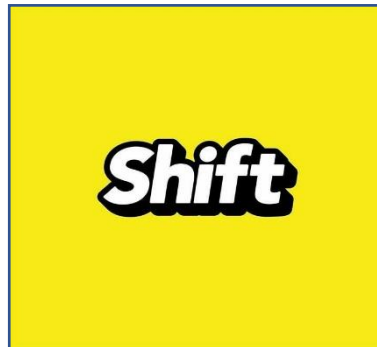
Gambar 4.1. Profil Akun Instagram Usd Hanan Attaki, Lc

a. Profil Instagram Usd. Hanan Attaki, Lc.