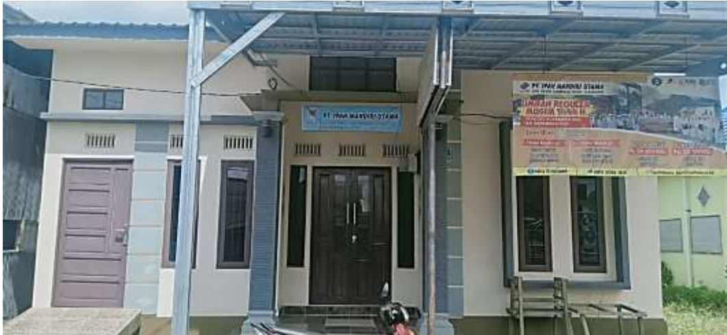
Gambar 1. Kantor PT. Ipah Mandiri Utama