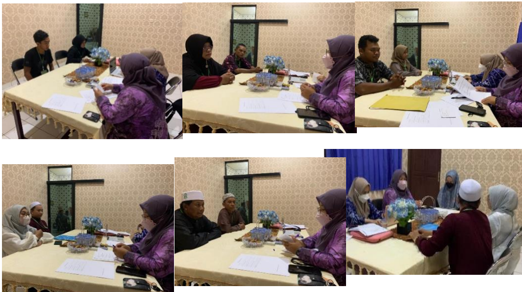
Konseling dispensasi nikah bersama dengan konselor dari Dinas Pengendalian Penduduk, Keluarga Berencana, Pemberdayaan Perempuan dan Perlindungan Anak Kabupaten Tanah Laut