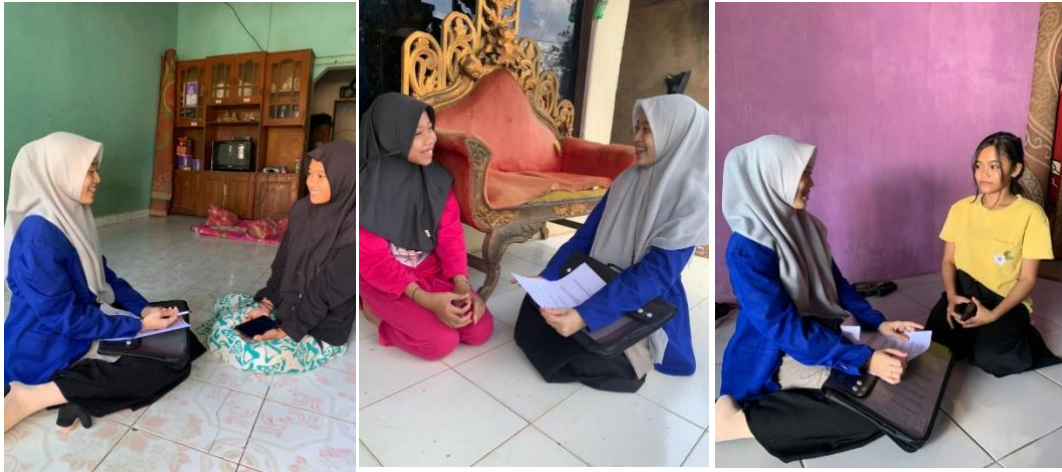
Wawancara dengan para remaja perempuan yang mengikuti kegiatan sosialisasi