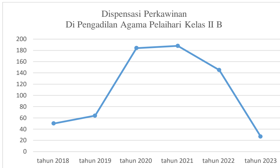
Gambar 4. 3 Grafik Jumlah Dispensasi Nikah di Kabupaten Tanah Laut