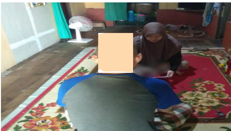
Wawancara dengan MTA di kediamannya pada 23 Februari 2023