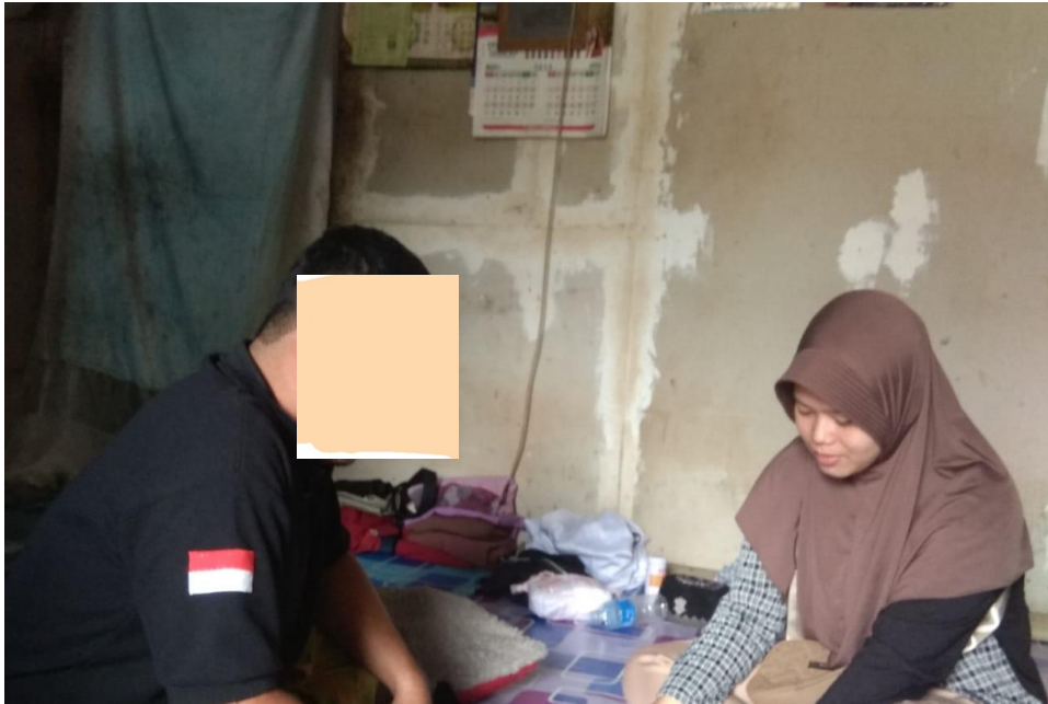
Wawancara dengan S di kediamannya 27 Februari 2023