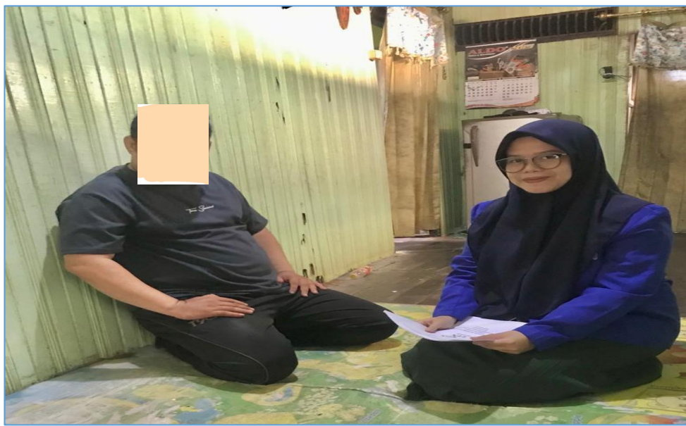
Wawancara dengan MA di kediamannya pada 20 Februari 2023