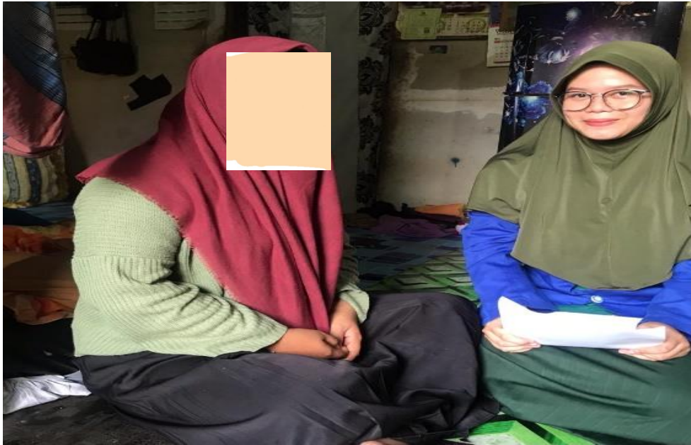
Wawancara dengan SA di kediamannya 28 Februari 2023