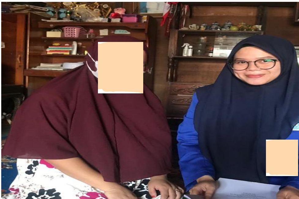
Wawancara dengan M di kediamannya 01 Maret 2023