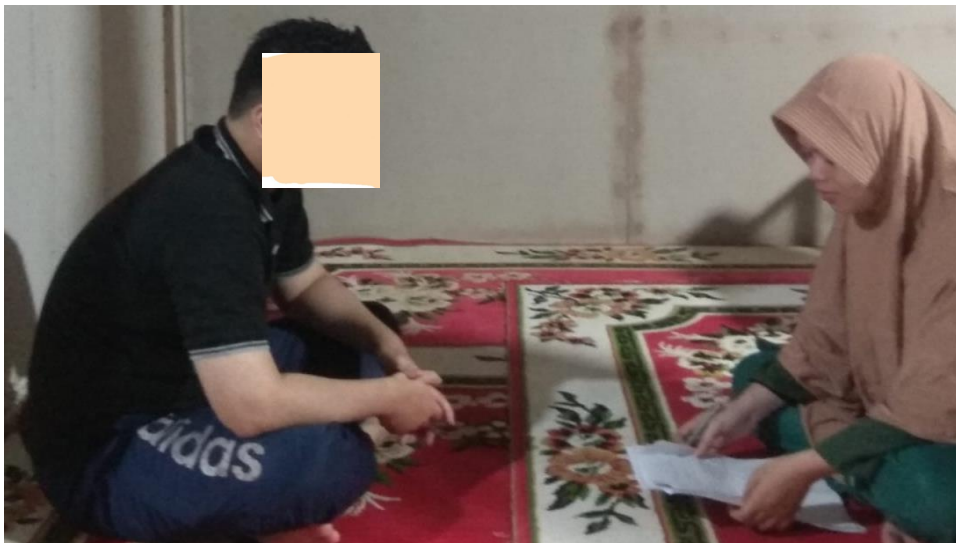
Wawancara dengan AFR di Kediamannya 05 Maret 2023