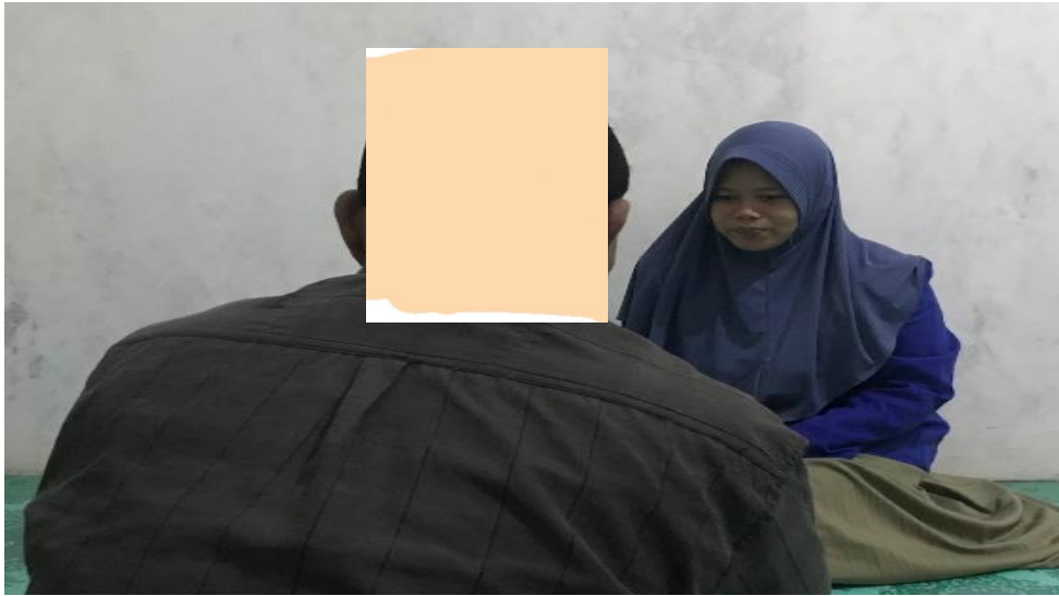
Wawancara dengan T di kediamannya 05 Maret 2023