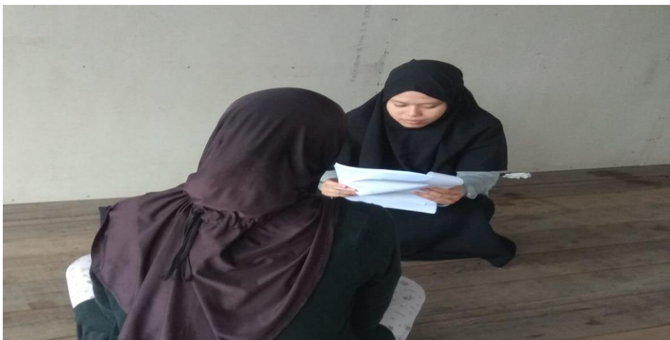
Wawancara dengan F di kediamannya 05 Maret 2023