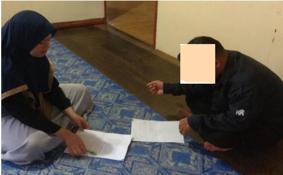
Wawancara dengan MT di kediamannya 02 Februari 2023