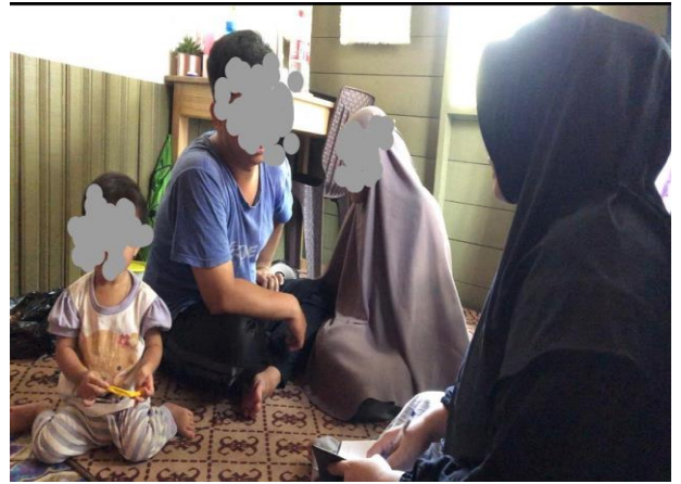
wawancara bersama pasangan MH dan H