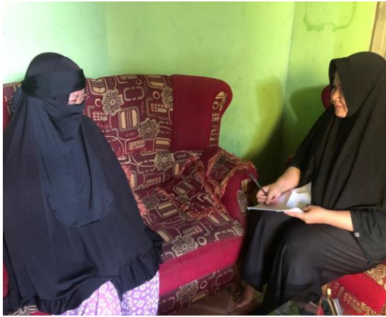
Wawancara bersama SH