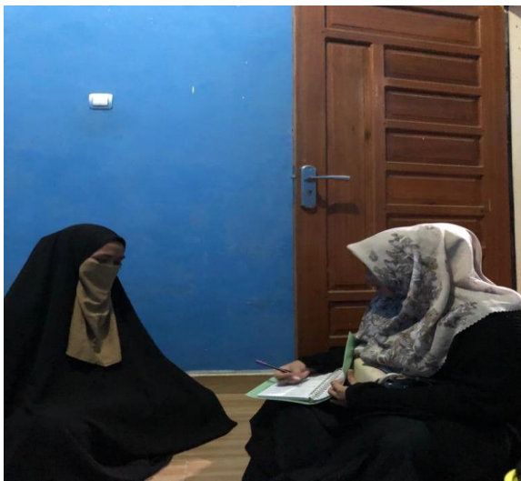
Wawancara bersama AZ