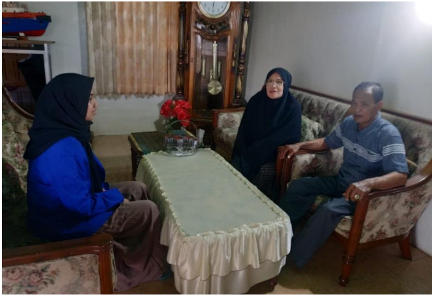
Cabang Muhammadiyah 11 Banjarmasin.