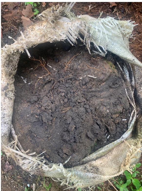
Gambar 8. Pasir Puya