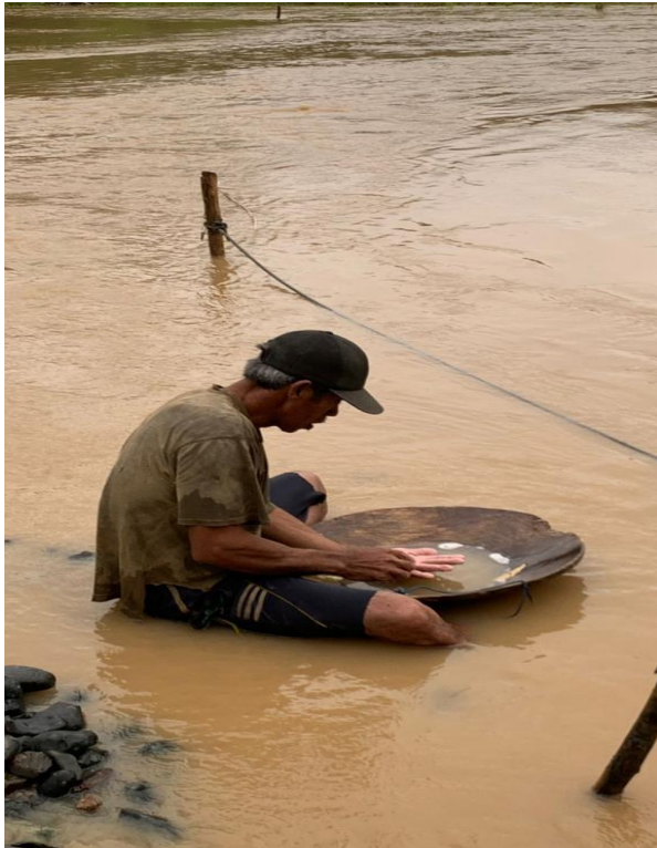
Gambar 7. Melinggang (dalam bahasa banjar) adalah proses memisahkan pasir dengan emas menggunakan media linggangan (topi kerucut berbentuk terbalik)