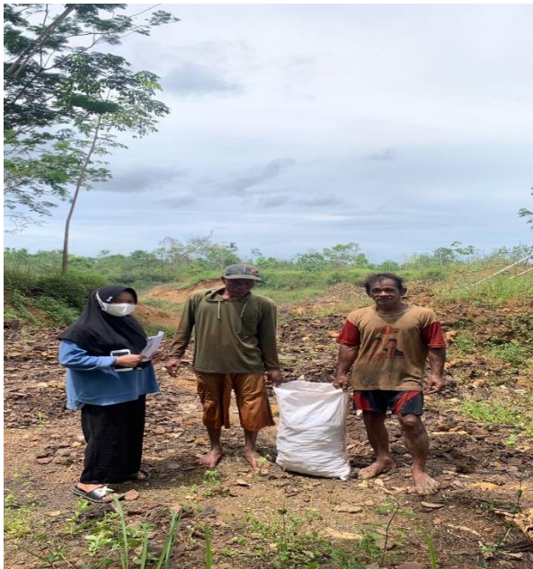
Gambar 3. Proses pembelian pasir puya yang mengandung emas