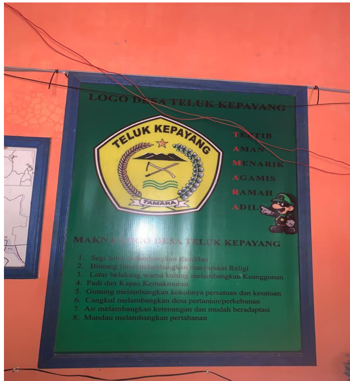
Gambar 10. Logo Desa Teluk Kepayang