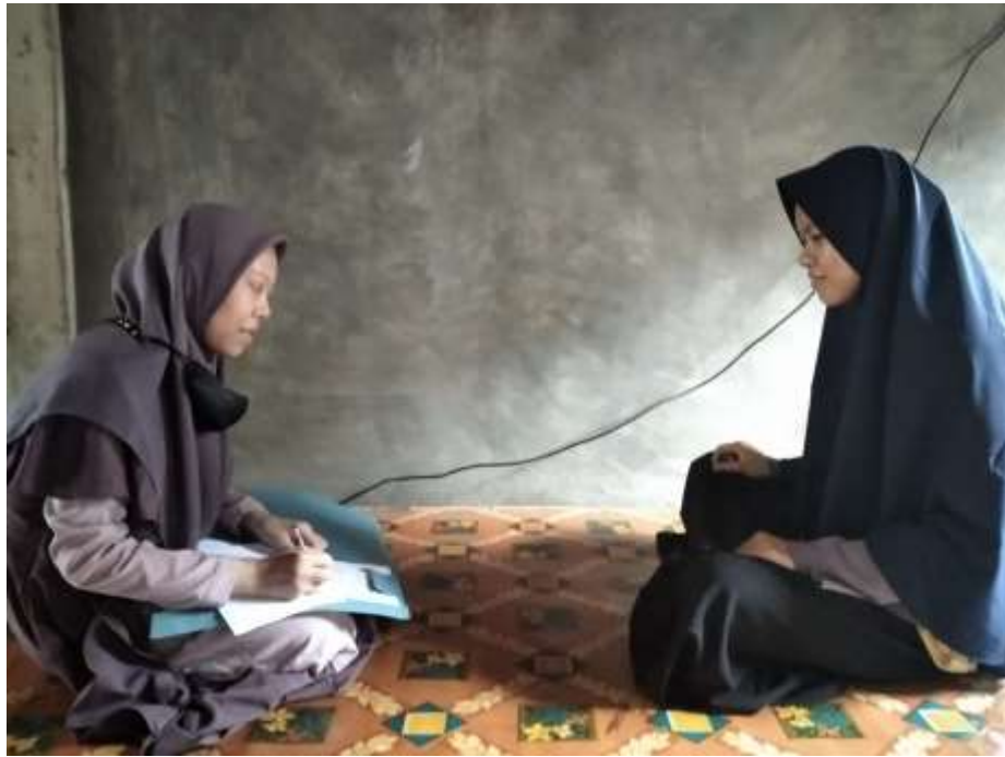
Wawancara dengan IA