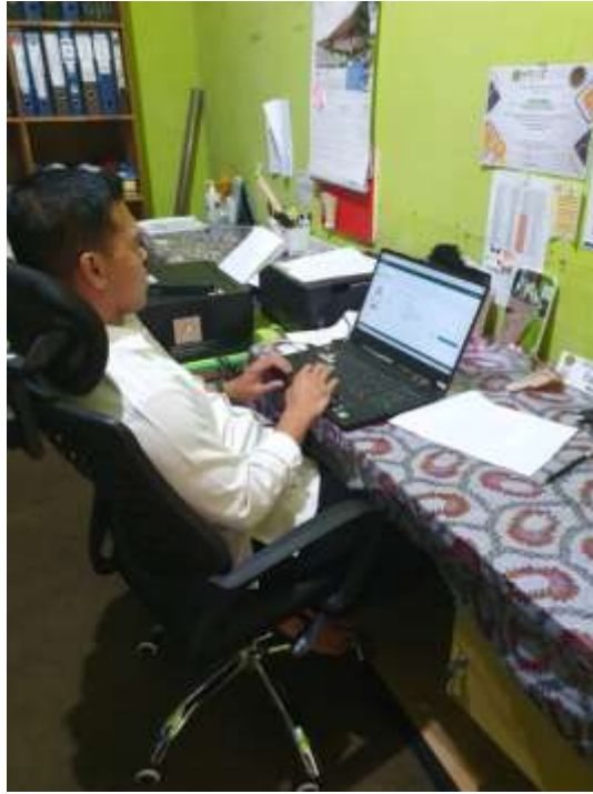
Wawancara dengan KN