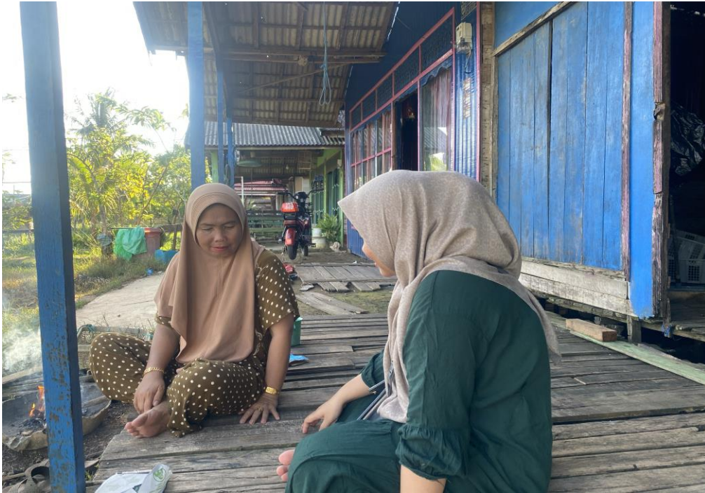
Dokumentasi wawancara dengan informan 4