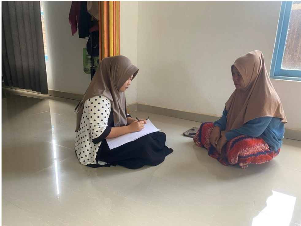
Dokumentasi wawancara dengan informan 1