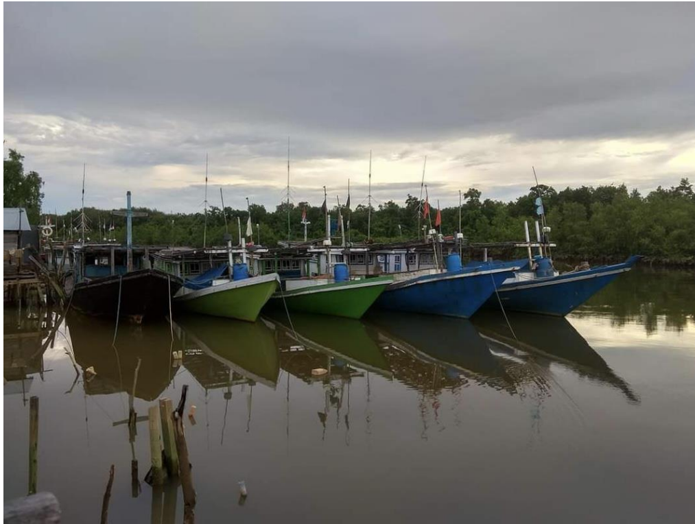
Gambaran kapal nelayan