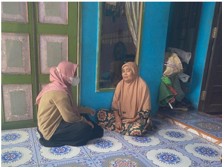
Dokumentasi wawancara dengan informan 2