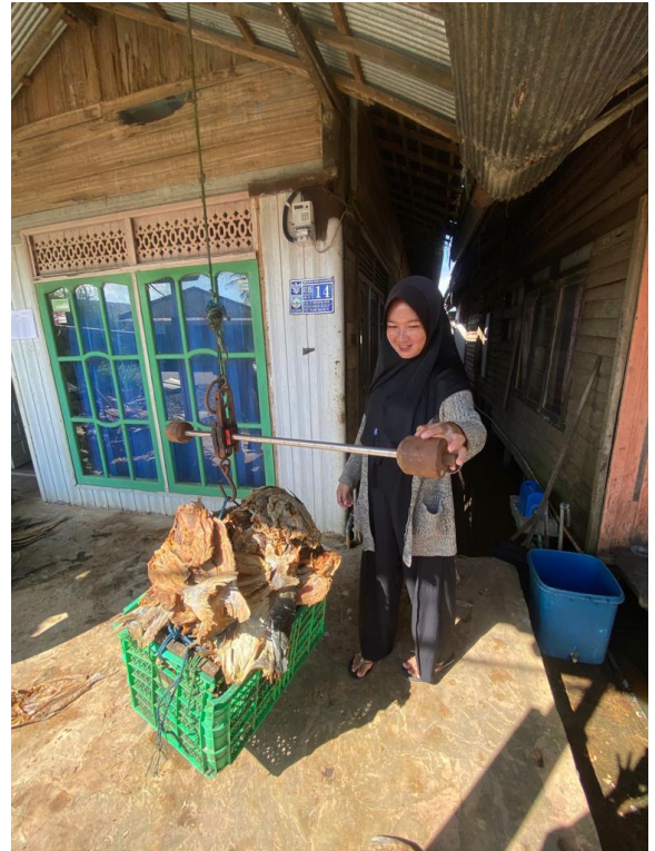
Gambaran menimbang ikan asin