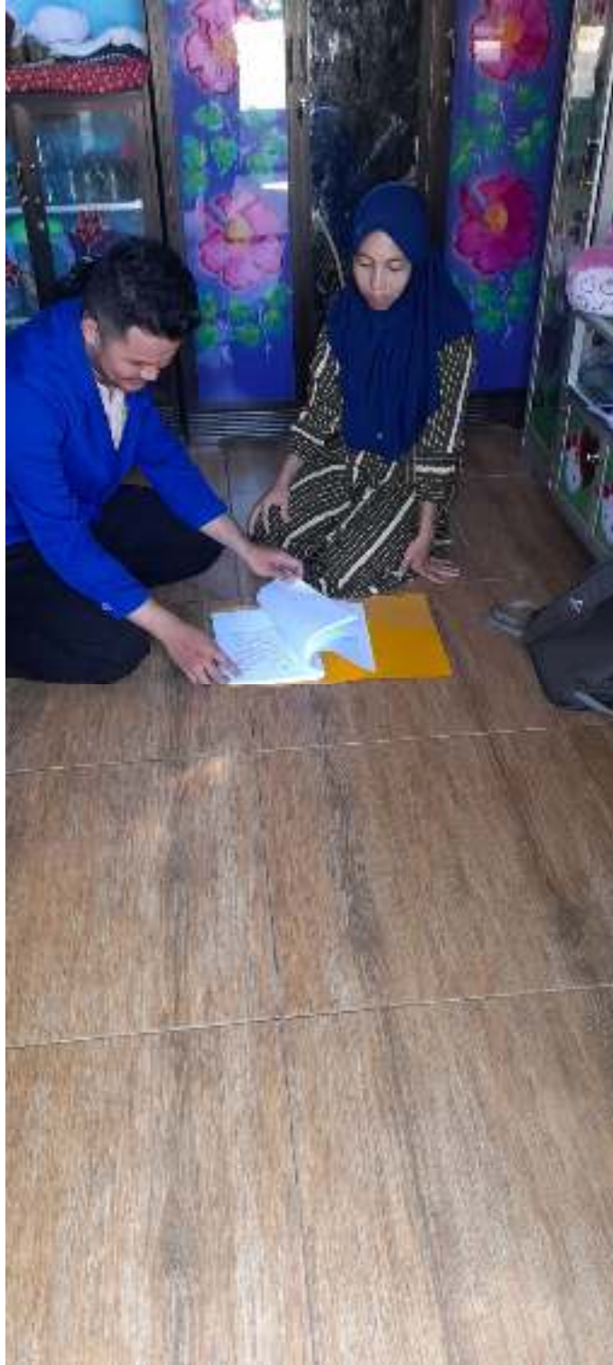
(Wawancara dengan pembeli)