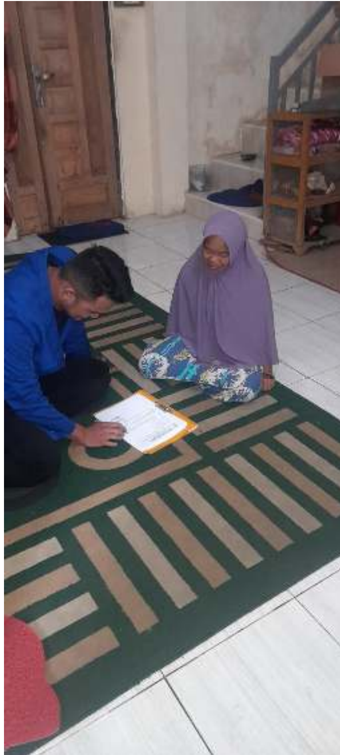
(Wawancara dengan pembeli)