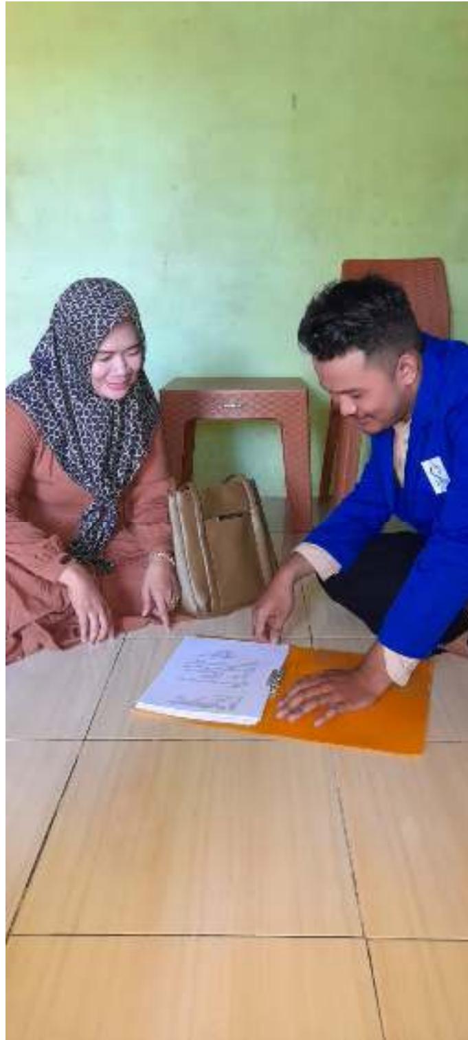
(Wawancara dengan penjual)