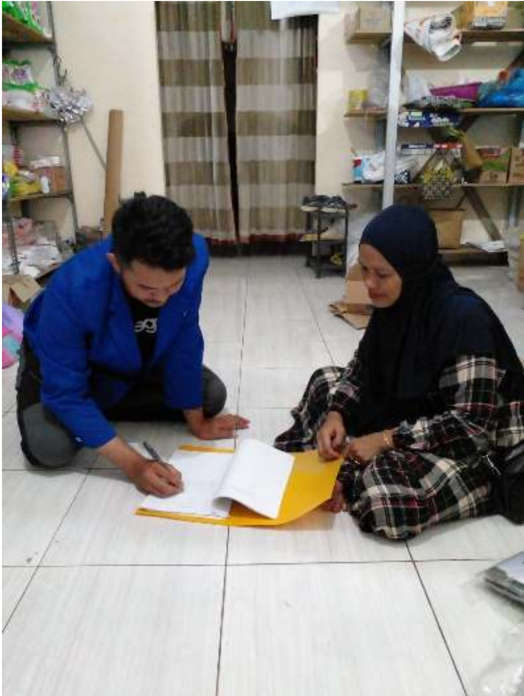
(Wawancara dengan pembeli)