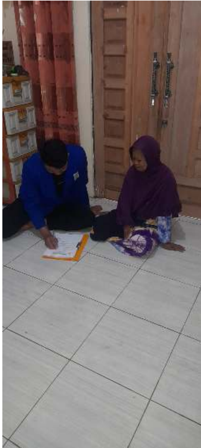
(Wawancara dengan pembeli)