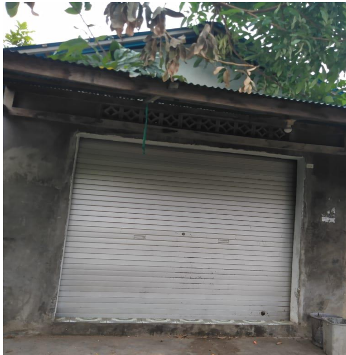
Kios yang di wasiatkan kepada anak angkat