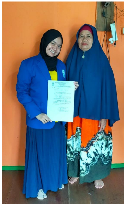
Wawancara dengan A (saudara dari Ibu U)