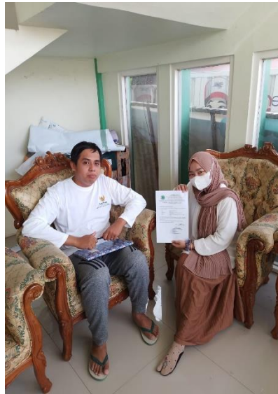
Menyerahkan Surat Riset Dengan Lembaga MUI