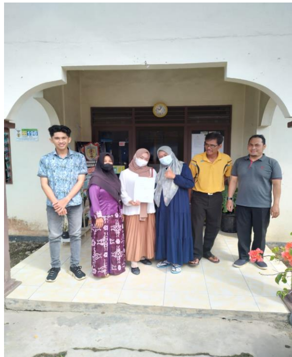
Menyerahkan Surat Riset Ke Kelurahan Bukit