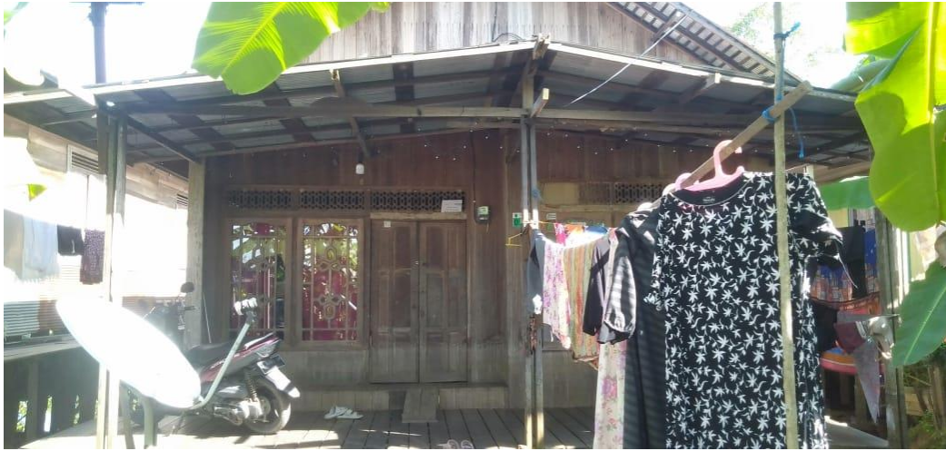
Rumah yang di wasiatkan kepada anak angkat