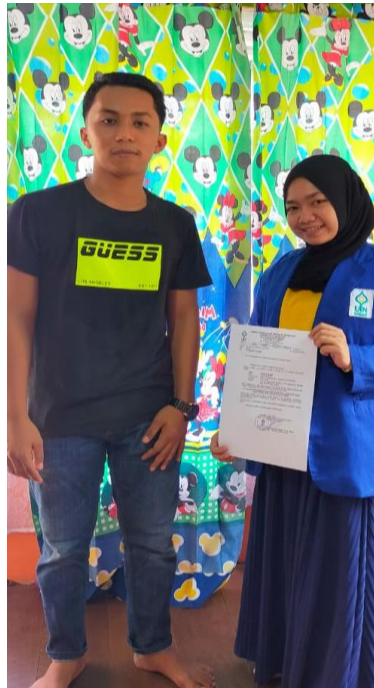
Wawancara dengan Saudara X (anak kandung)